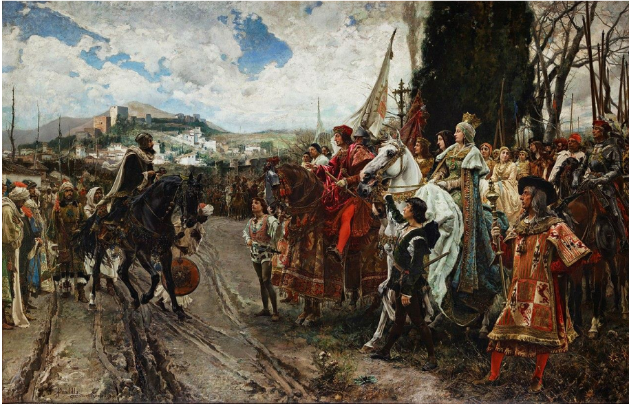
Prilog 5. Predaja Granade ( La rendición de Granada , Francisco Pradilla 1882.)