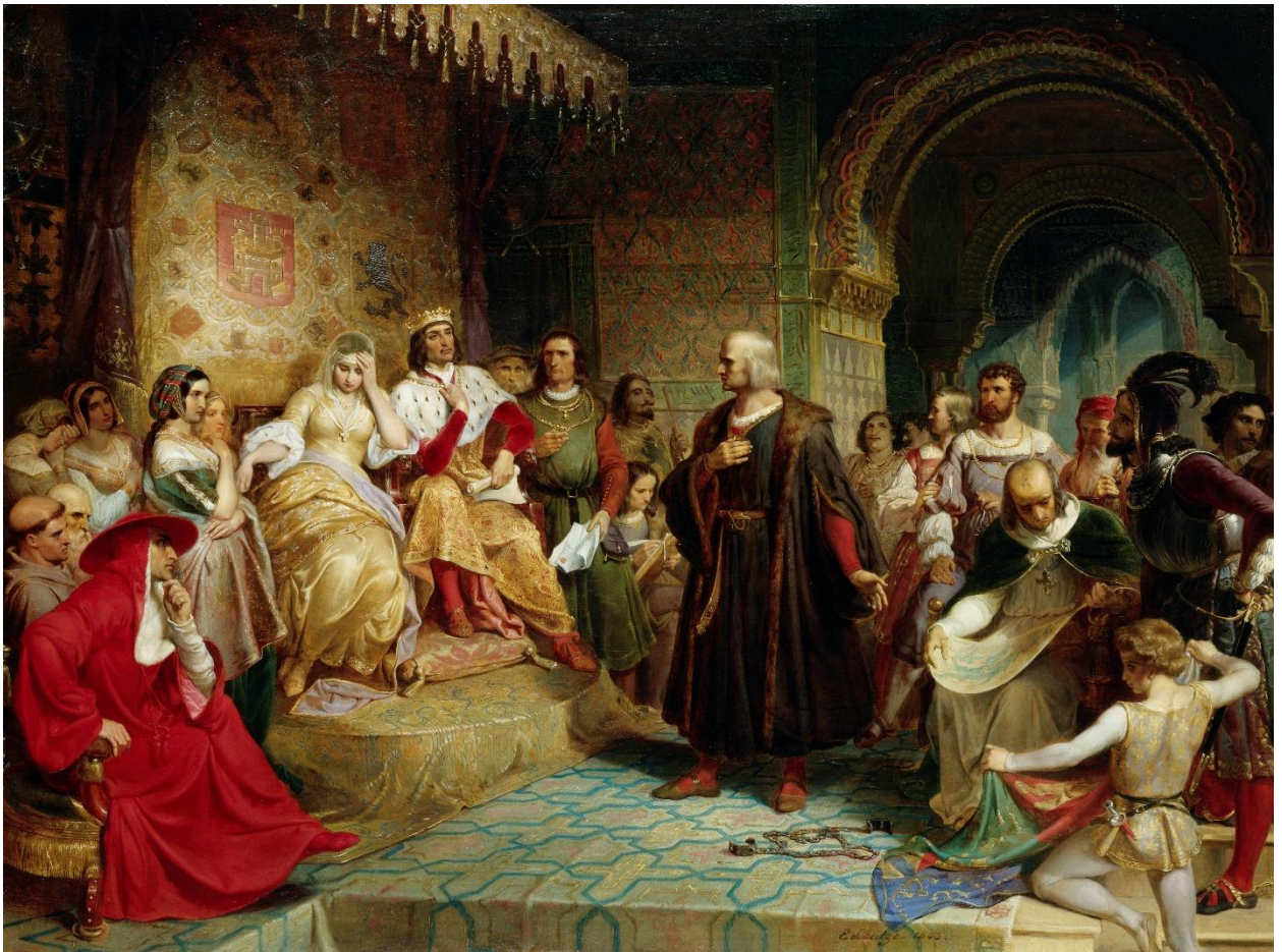
Prilog 6. Izabela i Ferdinand primaju Kolumba