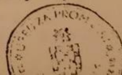
Slika 4. Popis zabranjenih knjiga iz 1942. godine 52

Desetorica s lomačo. 1000 najljepših novela /svi sv u kojima se nalaze prilosi pri navodnih pisaca/ Nova ruska proza Hitler osvajač "Nolit" i sva latinica na srpsk jeziku.-Novi ruski humor Židovski humor.