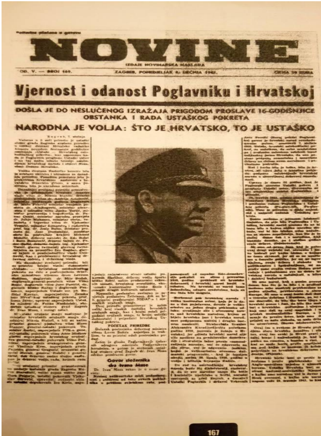
Slika 1. Obilježavanje 15. godišnjice Ustaškog pokreta 49