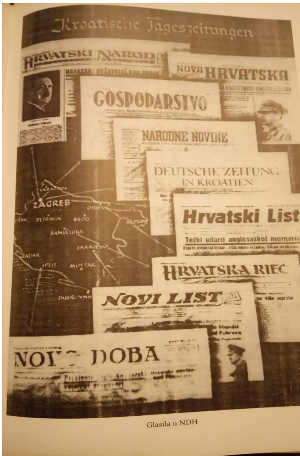
Slika 2. Glasila u NDH 50