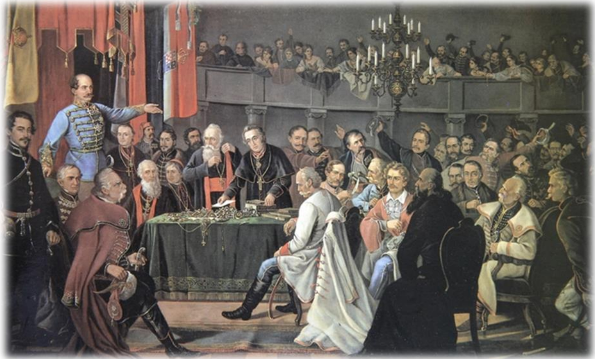
Prilog 3.: Proglas o ukinuću kmetstva