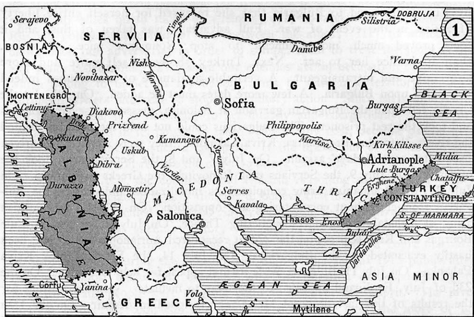
Slika 2. Prikaz teritorija nakon mirovne konferencije u Londonu