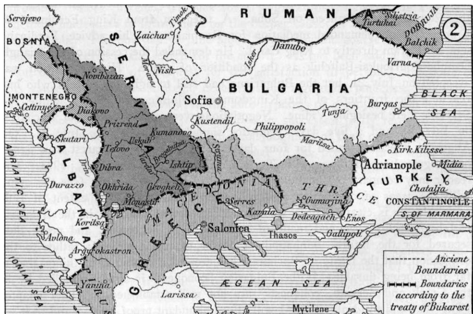
Slika 3. Prikaz teritorija nakon mirovne konferencije u Bukureštu