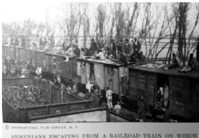
Prilog 5. Transport Armenaca u logore.