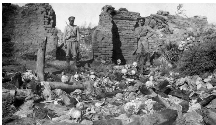
Prilog 12. Turski vojnici nakon masakra u armenskom selu Sheyخالan.