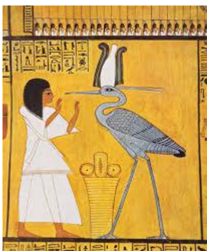
Prilog 8: Prikaz ptice Bennu