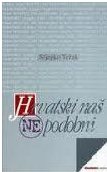
Slika 2 Hrvatski naš (ne)podobni