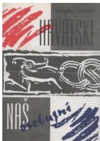
Slika 3 Hrvatski naš osebujni