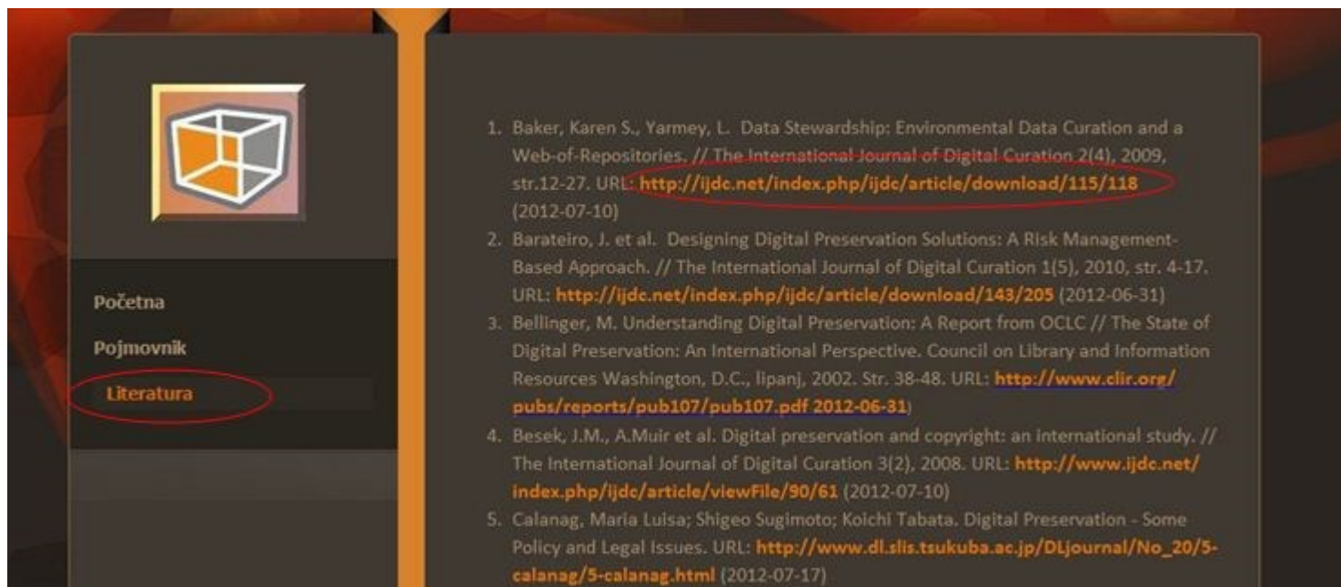
Prikaz mrežne stranice popisa korištene literature