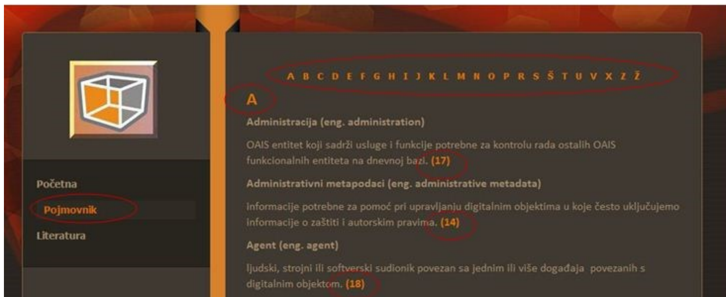
Prikaz mrežne stranice Pojmovnika zaštite elektroničkih dokumenata