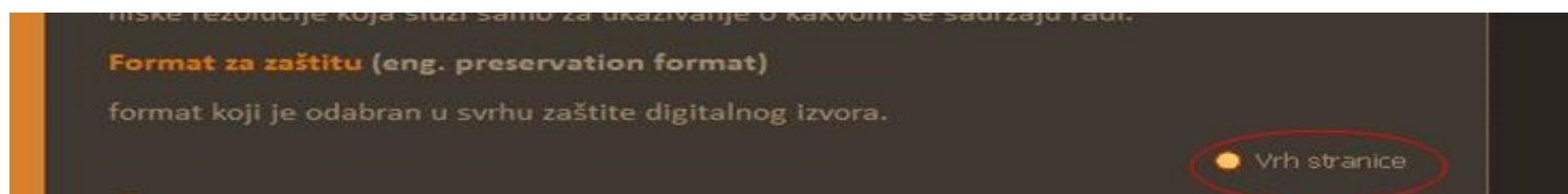
Prikaz poveznice koja vodi na vrh stranice pojmovnika