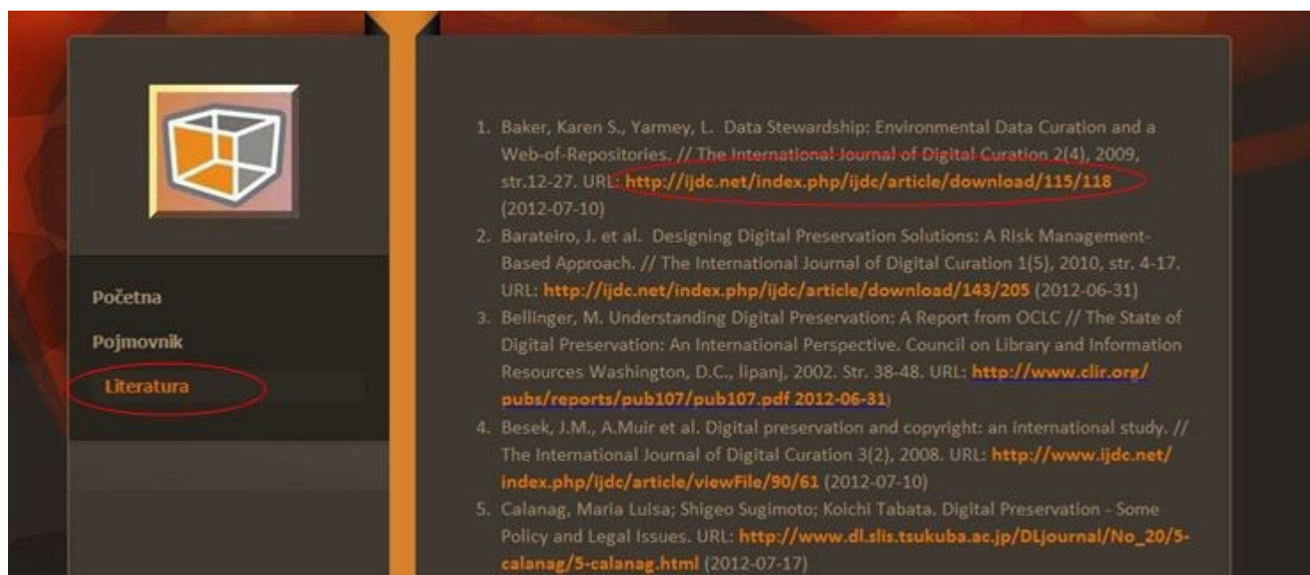
Prikaz mrežne stranice popisa korištene literature