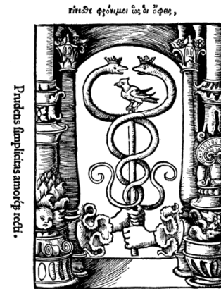
Prilog 6. Froben t. znak