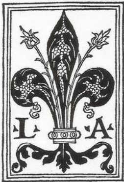
Prilog 1. Giunta t. znak