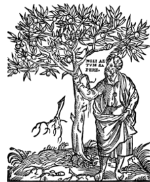
Prilog 9. Estienne t. znak