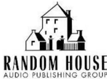
Prilog 22. Random house logo