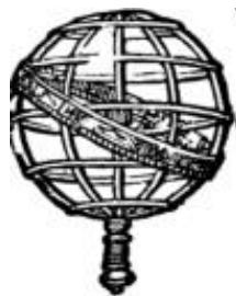
Prilog 8. Elzevir kugla