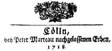
Prilog 10. Riverside Press t.znak Prilog 11. Penguin logo Prilog 12. Peter Marteau t.znak