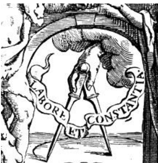
Prilog 7. Plantine t. znak