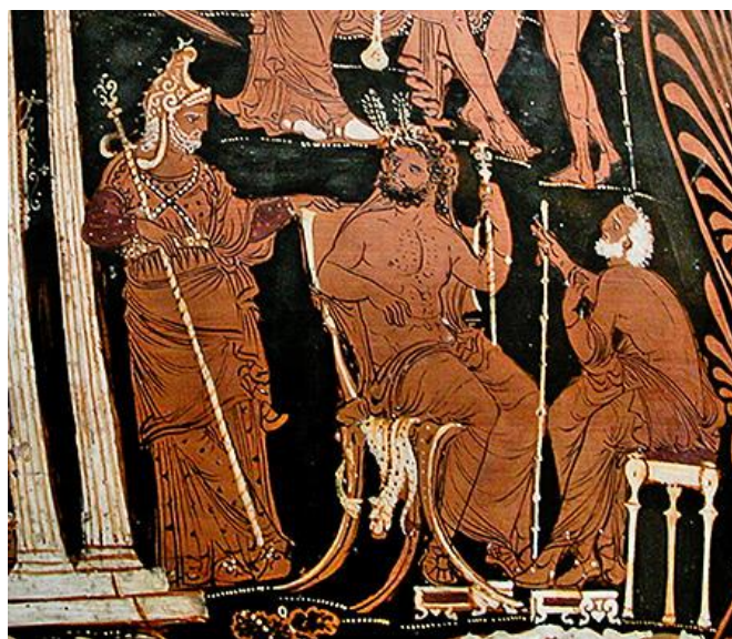
Prilog 6: Prikaz triju sudaca u Hadu