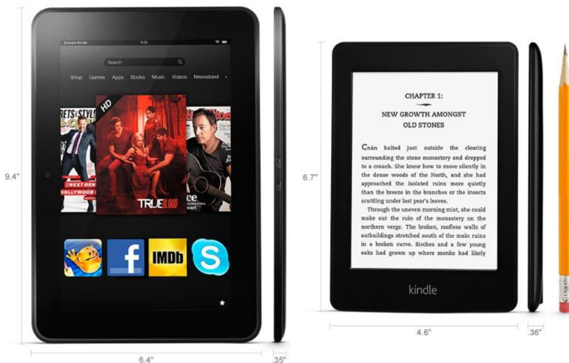
Slika 16. Kindle Fire HD 4G 89 i Kindle Paperwhite 3G 90

Poput Goodreads i Shelfari zajednica koje ćemo kasnije navesti, i Kindle platforma ima nekih sličnih značajki korisnih za čitatelje elektroničkih knjiga. Svaki čitatelj ako to želi može odabrati svoje čitateljske navike učiniti vidljivima ostalim Kindle korisnicima. Postoji mogućnost objave statusa čitanja, ocijene, te mogućih bilješki za svaku knjigu posebno. Svaku knjigu može se označiti statusom čitanja, a Kindle nudi četiri kategorije: knjige koje je čitatelj pročitao, knjige koje čitatelj želi pročitati, knjige koje je čitatelj prestao čitati i knjige koje čitatelj trenutno čita. Čitatelj svoj čitateljsko iskustvo može podijeliti putem tri osnovne funkcije objave: Share (podijeli) – objava statusa čitanja ili zanimanja za neku knjigu, Highlighted (podvučeno – čitatelj ima mogućnost označavanja dijelova teksta i odabira zanimljivih citata) i Public Notes (javne bilješke – čitatelj sam stvara vlastitu zabilješku u knjizi koja bi bio svojevrsni ekvivalent pisanju po marginama u tiskanim izdanjima) Neke od zanimljivijih proizvoda ovih objava su popis knjiga sa najviše javnih zabilješki (Public