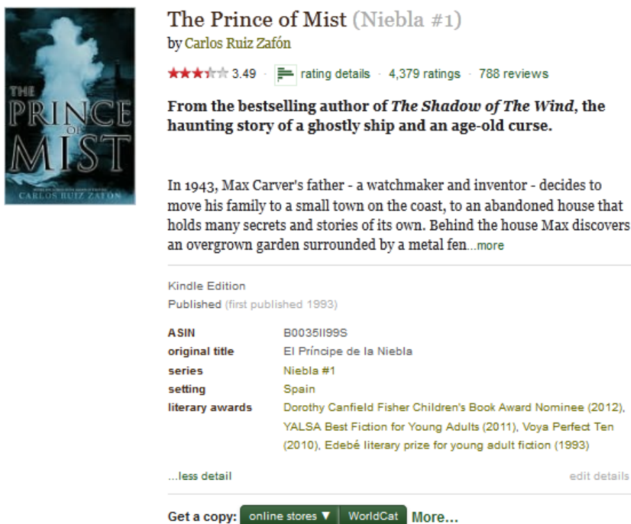
Slika 19. Izgled zapisa knjige Goodreads 99

Nudi se i program za autore, te pomoć za nove autore i nekoliko načina promocije autorskih izdanja. Svaki čitatelj može dodati neku novu knjigu ukoliko ona već ne postoji ili dodati naslovnicu izdanja koje on posjeduje, ali sve promjene evaluiraju mrežni knjižničari koji djeluju u sklopu zajednice.