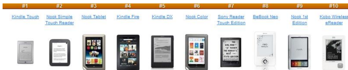
Slika 14. Prikaz nekih od najpopularnijih e-čitača na tržištu 83

Mini 82 . Vrlo je kompaktan i lagan u usporedbi s nekim drugim čitačima (standardna veličina je od 5 do 6 inča u promjeru). BeBook podržava PDF i ePub format, te skoro sve vrste datoteka koje mogu biti tekstualne.