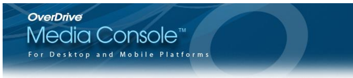
Slika 15. OverDrive vizalni identitet 84

OverDrive je vodeći distributer digitalnih sadržaja – elektroničkih knjiga, audio knjiga i ostalih digitalnih sadržaja. Pružatelj je usluga za izdavače, knjižnice, škole i trgovce. Tvrtka je nastala 1986. godine, a sjedište joj se nalazi u Clevelandu u američkoj državi Ohio. Trgovinom digitalnih sadržaja bavi se od svog nastanka i jedan je od suosnivača organizacije International Digital Publishing Forum (IDPF) koja se bavi pitanjima razvoja i standardizacije digitalnih sadržaja – prvenstveno elektroničkih knjiga. 85 Platforme koje podržavaju sadržaje koje pruža OverDrive su: PC, Mac®, iPhone®, iPad®, Android™, BlackBerry® i Windows®. Od 2010. godine putem OverDrive aplikacija dostupna su i izdanja u sklopu Project Gutenberg-a, a od travnja 2012. godine osamnaest tisuća knjižnica partnera svojim čitateljima