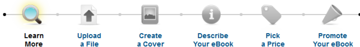
Slika 3. Lulu sučelje - How to publish your eBook 24