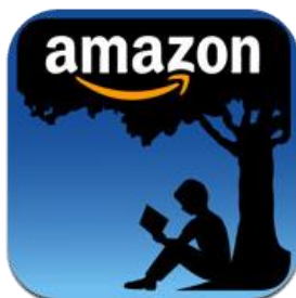
Slika 8. Vizualni identitet Kindle / Mobipocket 71

Kindle serija uređaja koju čine Kindle, Kindle Touch/Kindle Touch 3G, Kindle Keyboard 3G, Kindle DX, Kindle Fire/Kindle Fire HD/Kindle Fire HD 4G, te Kindle Paperwhite/Kindle Paperwhite 3G 72 , koristi format imenom Mobipocket kojeg je osmislila francuska tvrtka Mobipocket, a zovu ga još i Kindle format. Za razvoj ovog formata i njegovu upotrebu brine se američka kompanija Amazon, a jedan je od prvih korištenih formata elektroničkih knjiga.