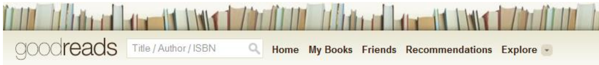
Slika 17. Goodreads vizualni identitet 95

„Znanje je moć; moć se najbolje dijeli među čitateljima“ 96