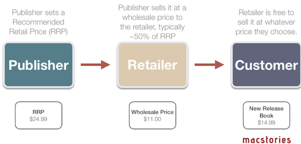
Slika 1. Wholesale Model 22

Prema tom modelu nakladnik određuje preporučenu maloprodajnu cijenu, a veleprodajni kupci i distributeri mogu knjigu nabaviti po oko upola manjoj cijeni. Na odluci je prodavača i distributera po kojoj maloprodajnoj cijeni žele staviti knjigu na tržište.