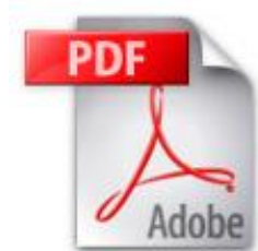
Slika 12. Vizualni identitet PDF (Adobe Portable Document Format) 77

PDF format jedan je od najstarijih i najuobičajenijih formata. Star je preko sedamnaest godina i pronalazi ga se u prodaji i distribuciji različitih tvrtki. Glavni nedostatak PDF formata u slučaju današnjih elektroničkih knjiga je nedostatak mogućnosti za sažimanje i korigiranje teksta za čitanje na manjim ekranima kakve imaju ručni čitači. Zbog toga je izrazito nepraktičan za čitanje na uređajima poput Kindle ili Sonyjevog čitača. DRM za PDF format se može riješiti preko Adobe Content Server opcije ili sa ugrađivanjem lozinke u datoteku. PDF format je čitljiv na većini računalnih sustava uz pomoć Adobe Acrobat Reader programa, te Kindle DX i Sony uređajima.