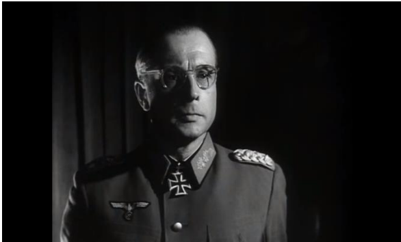
Abb.13: Offizier Beck erfährt, dass Goebbels nicht festgenommen wurde, Pabst (1:02:59)