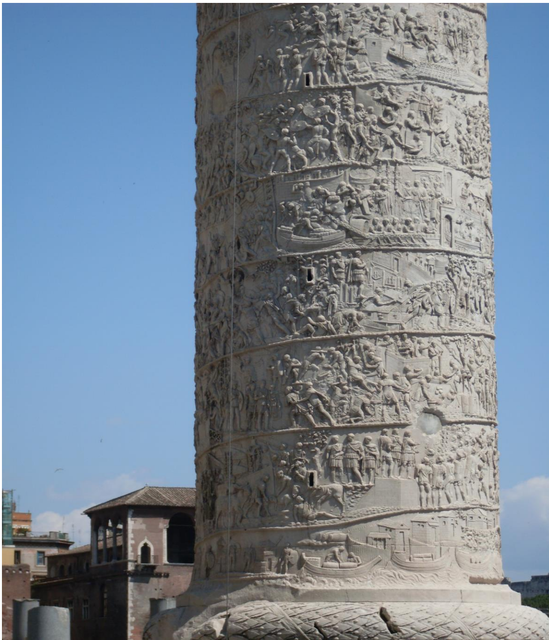
Prilog br. 1 Trajanov stup u Rimu