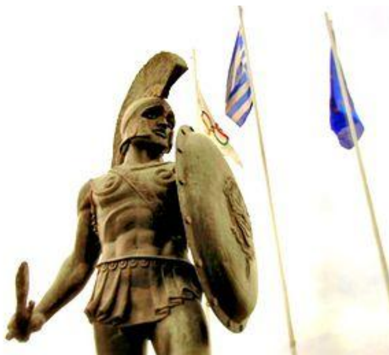
Prilog 4 – Kip spartanskog kralja Leonide