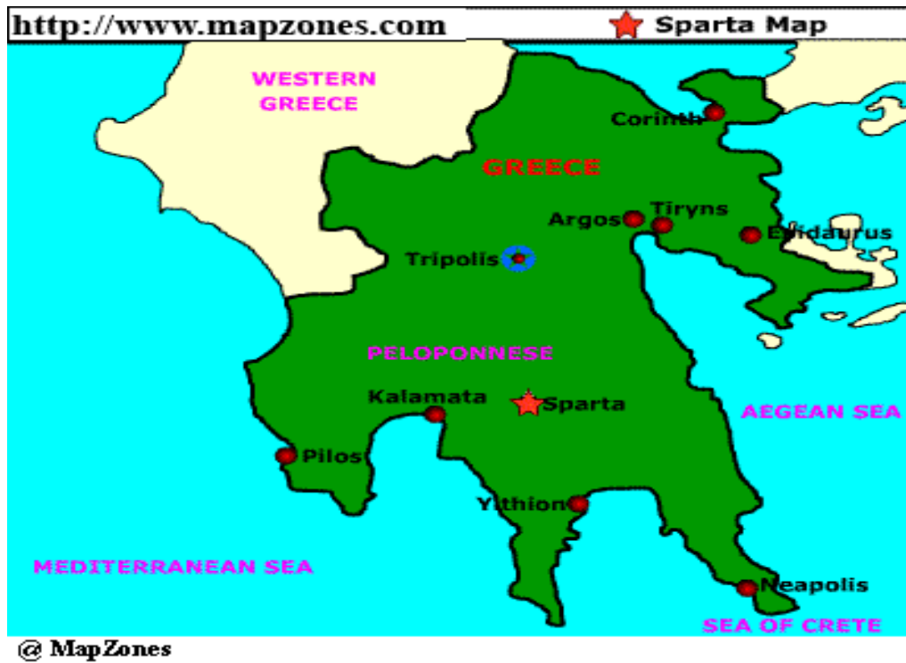
Prilog 1 – Položaj Sparte na karti Peloponeza