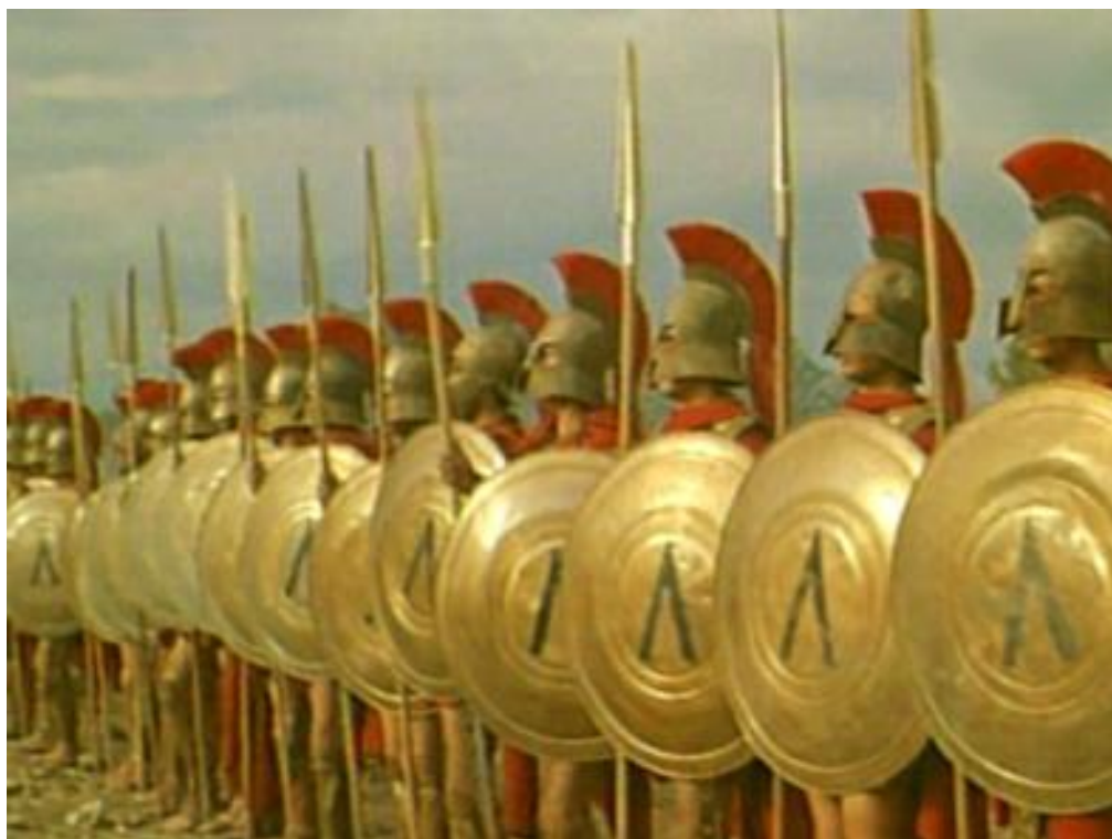
Prilog 3 – Spartanska falanga