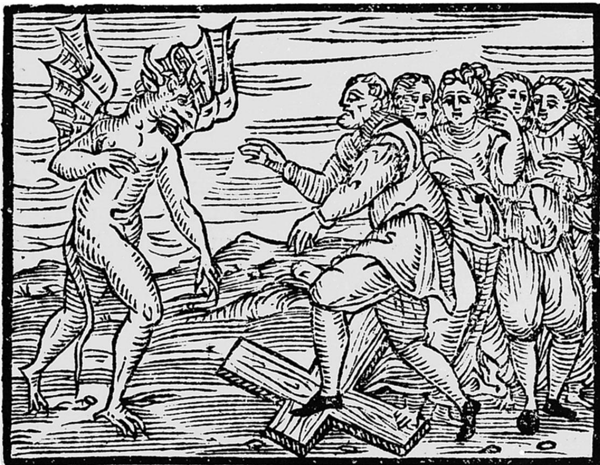
Sabat – vjerovalo se da vještice i čarobnjaci odlaze na tajni sastanak gdje obožavaju đavla