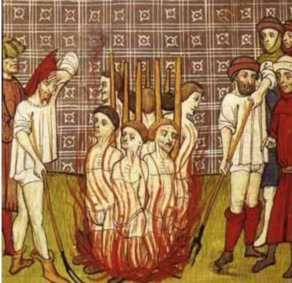
Mučenje i spaljivanje heretika