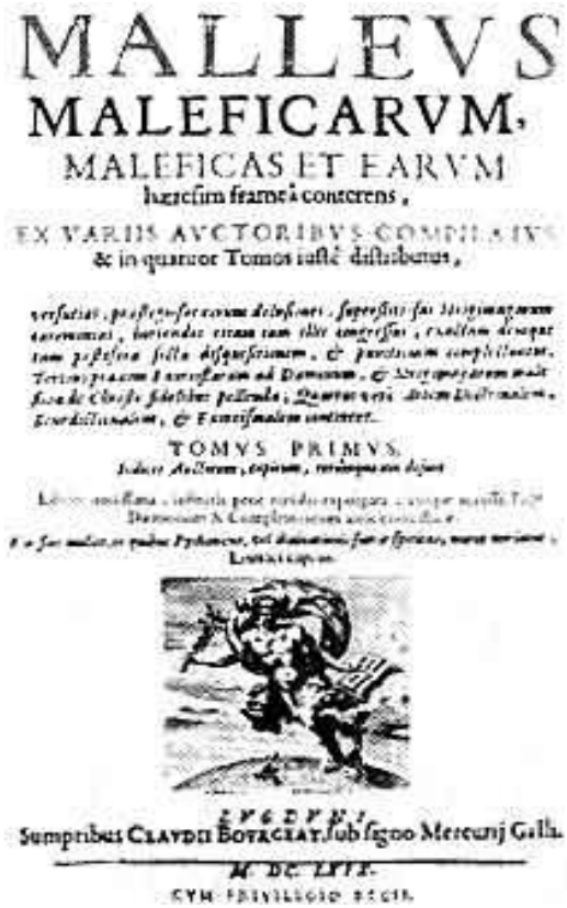
Malleus maleficarum – naslovnica originalnog prvog izdanja