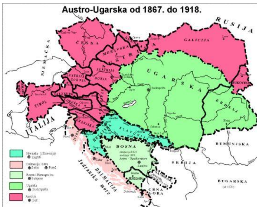
Slika 7. Karta Austro-Ugarske od 1867. do 1918. 52

Padom Bachova apsolutizma (1859.), Hrvatskoj je vraćen Ustav, obnavlja se parlamentarni život (zemaljski Sabori), uistinu i stvarno hrvatski jezik postaje službenim. Dalmacija i Istra (do 1860. Istarsko okružje) dobile su po prvi puta u povijesti, svoje posebne zemaljske sabore. Vojna krajina u suštini zadržala je svoje dotadašnje uređenje. Hrvatske su zemlje u ustavno razdoblje ušle razjedinjene i pored toga što su formalno imale pravo i mogućnost ujedinjenja. Veliko i homogeno Austrijsko carstvo više se nije moglo održavati i njegovim temeljnim preuređenjem stvorena je nova Austro-Ugarska država (1867.). Prema novom ustrojstvu, Dalmacija i Istra ostaju u nadležnosti Austrije, a Hrvatska i Slavonija dolaze u nadležnost Ugarske s kojom trebaju sklopiti poseban ugovor, kojim će regulirati međusobne odnose. Vojna krajina ostaje posebno i izdvojeno područje do svog ukidanja (1881.) i uključivanja u sastav Hrvatske (1886.) godine. U navedenim državno-pravnim okvirima Hrvatska ostaje do završetka Prvog svjetskog rata, te godine 1918. ulazi u novu državno-pravnu zajednicu Kraljevinu Srba Hrvata i Slovenaca (1.XII.1918.), odnosno u Kraljevinu Jugoslaviju (6.I.1929). 51