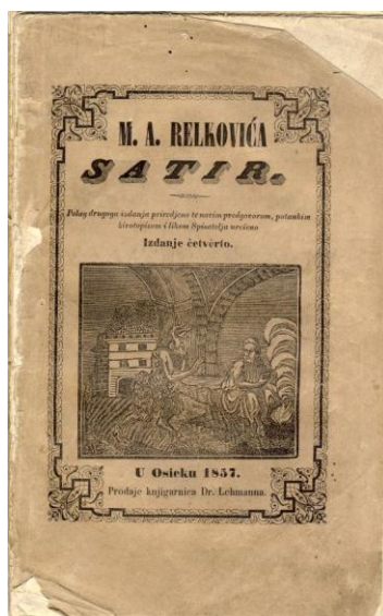
Prilog 3: Primjer digitalizirane naslovne stranice tiskovine iz zavičajne zbirke Essekiana