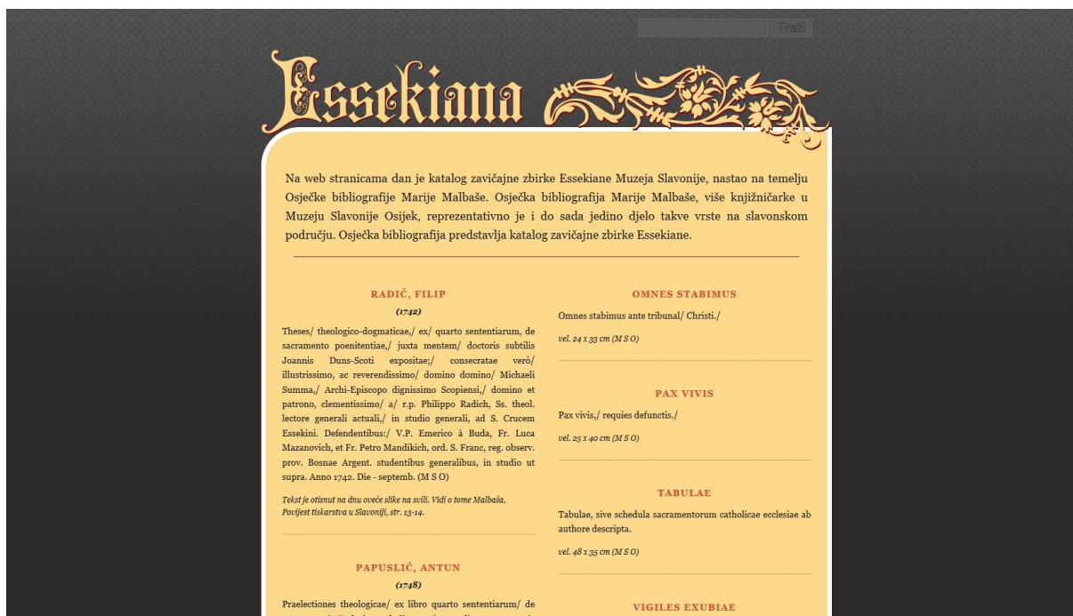
Prilog 2: Izgled početne stranice mrežnog kataloga zavičajne zbirke Essekiana na internet stranici Muzeja Slavonije Osijek - http://www.mso.hr/essekiana/