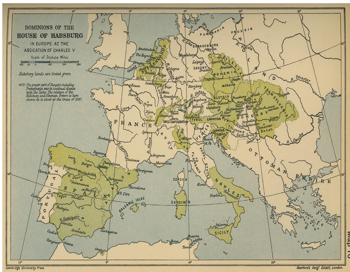
Slika 4. Posjedi habsburške obitelji u vrijeme abdikacije cara Karla V.