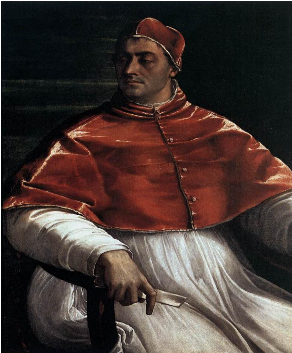
Slika 7. Papa Klement VII.