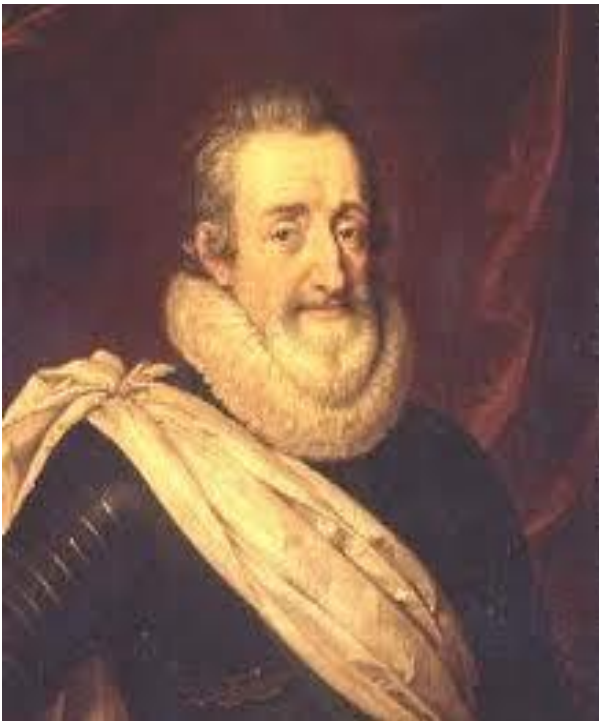
Slika 11. Henrik II.