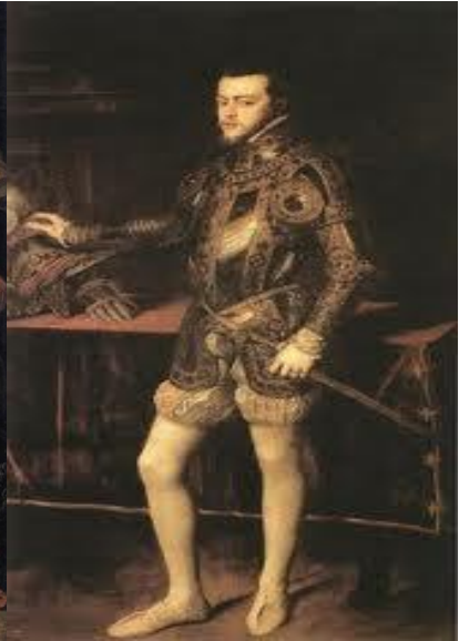
Slika 14. Filip II.