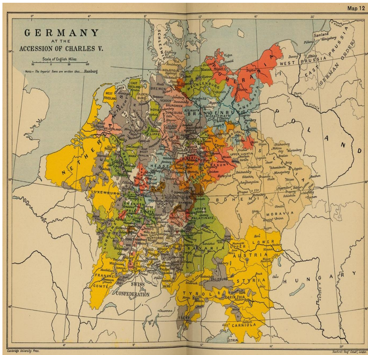
Slika 3. Sveto Rimsko Carstvo u vrijeme vladavine Karla V.