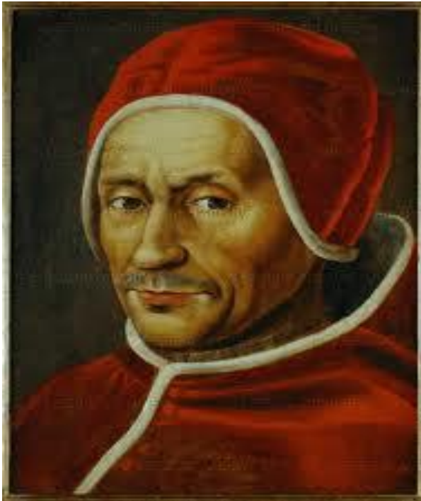
Slika 5. Papa Hadrijan VI.