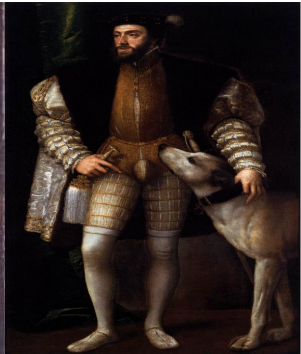
Slika 12. Car Karlo V.