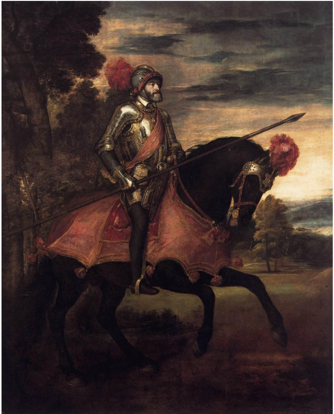
Slika 1. Car Karlo V.