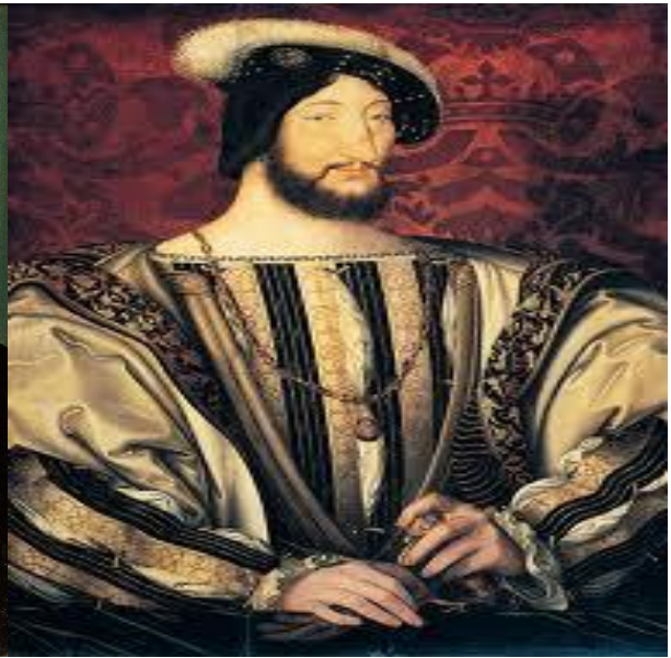
Slika 10. Franjo I.