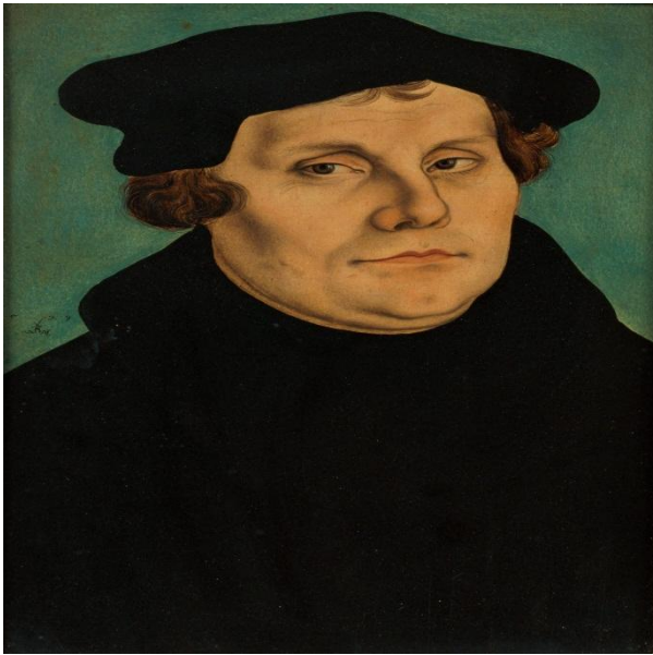
Slika 9. Martin Luther