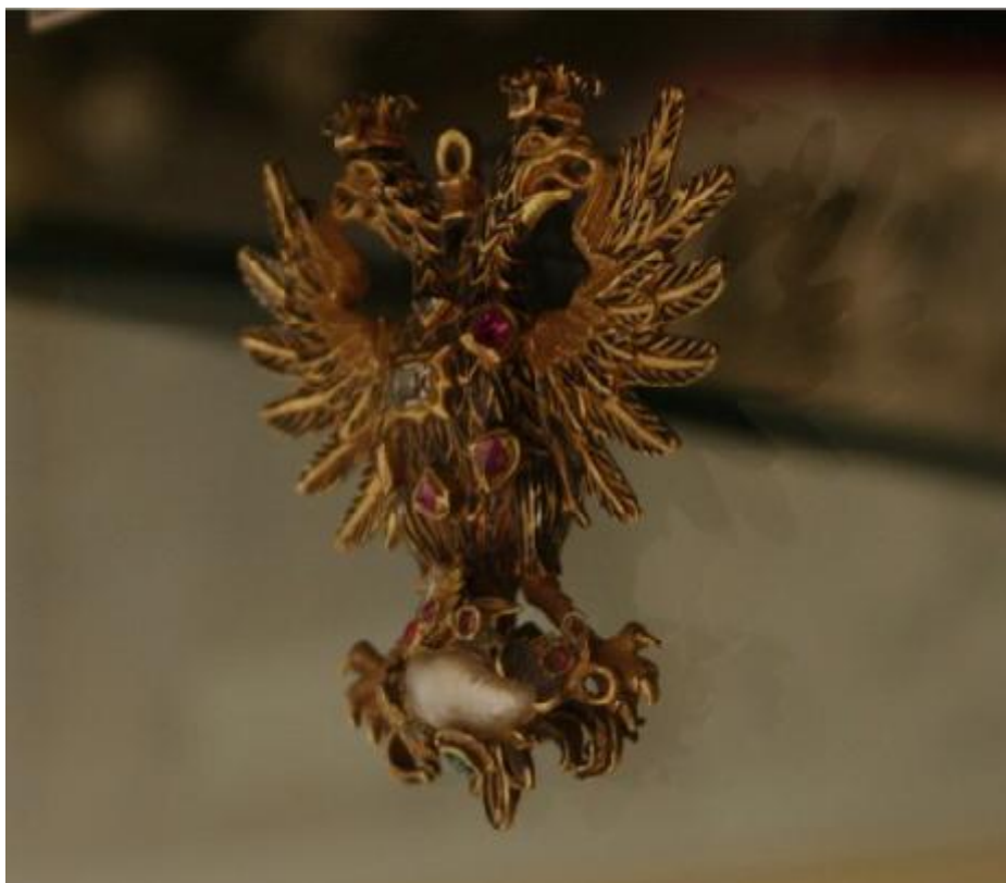
Slika 17. Zlatni dvoglavi orao cara Karla V. poklonjen franjevačkom samostanu na Trsatu 1536. godine.