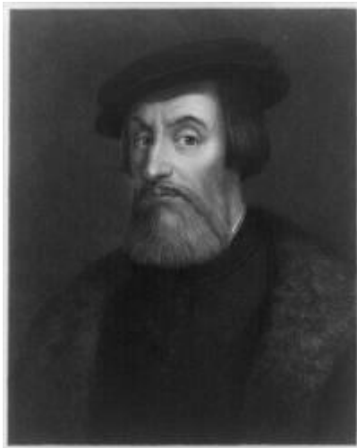
Slika 15. Hernán Cortés