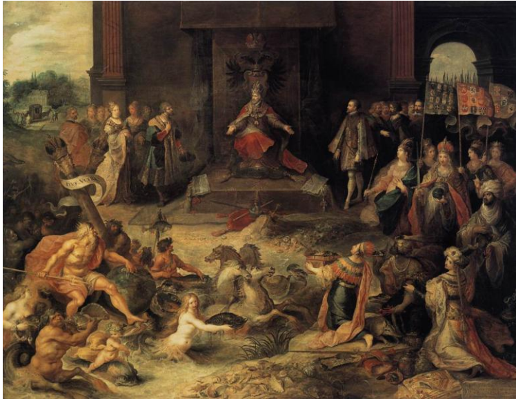
Slika 13. Abdikacija cara Karla V.