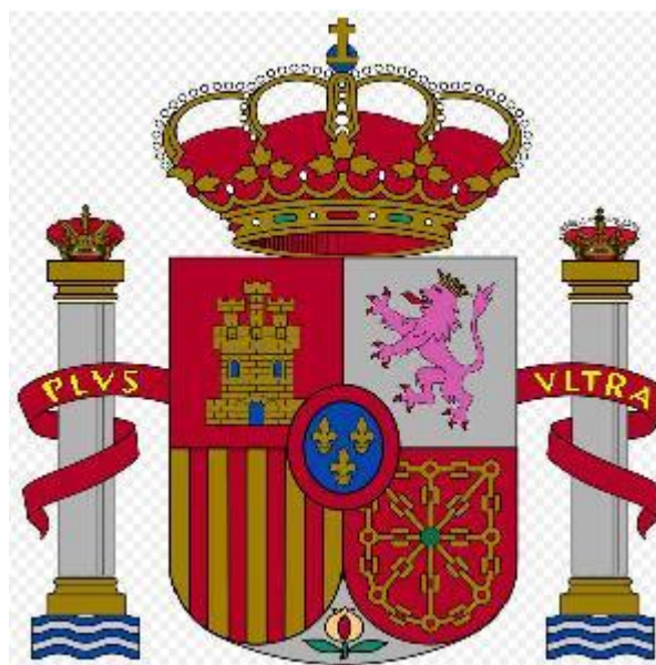
Slika 18. Plus ultra (lat. "još dalje") je nacionalno geslo Španjolske dobiveno od osobnog gesla Karla V.