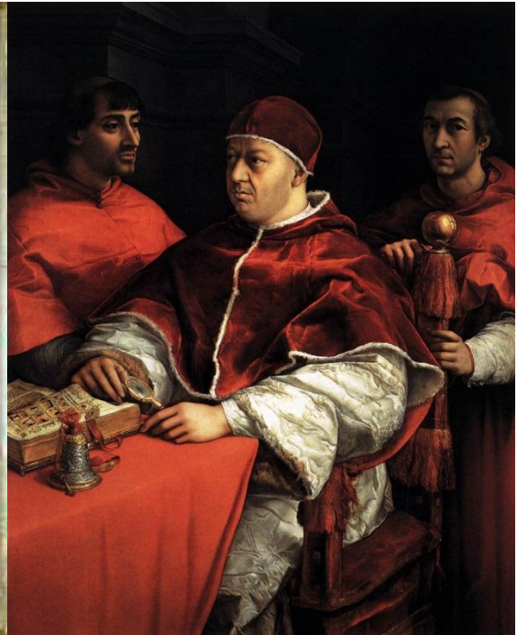
Slika 6. Papa Lav X.