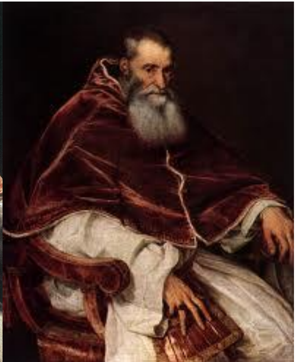
Slika 8. Papa Pavao III.