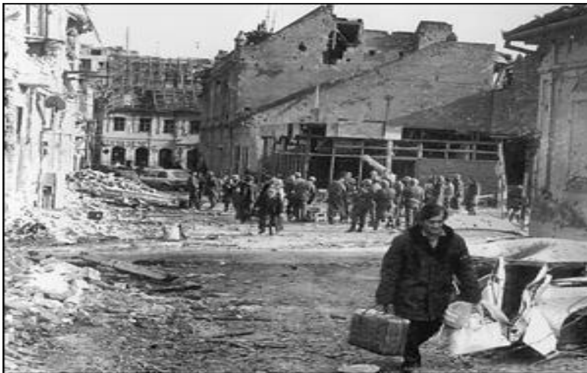
6. Nakon tri mjeseca borbe, Vukovar je 18. studenoga 1991. pao u srpske ruke

cijelom gradu. Nema više grada. (Kirin 2001: 10) O ljubavi prema jednome gradu nešto najljepše napisao je Siniša Glavašević 8 .