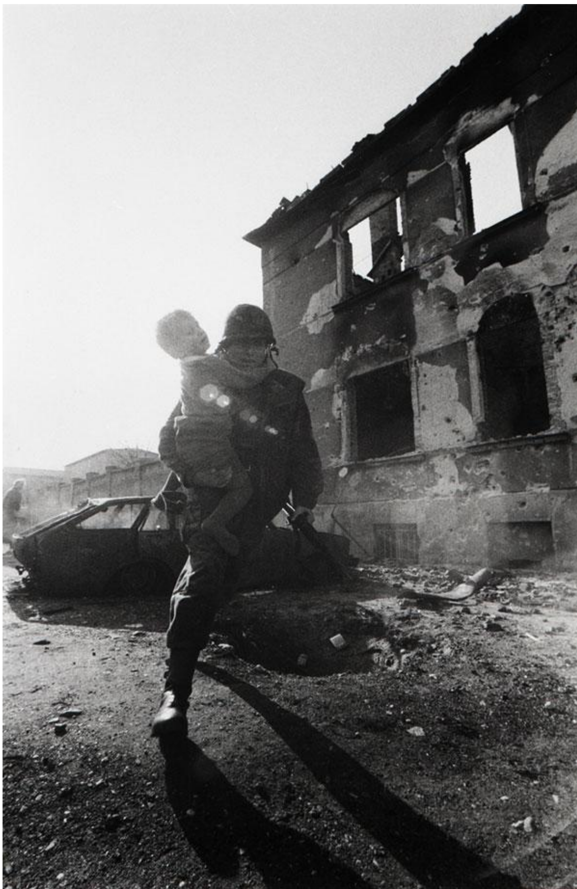
4. Hrvatski vojnik u trku nosi dijete, Osijek, 1991., Foto: Marin Topić