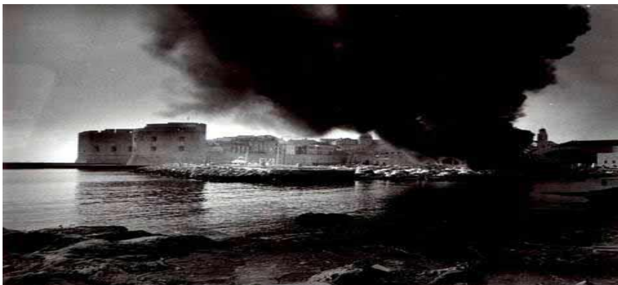
1. Dubrovnik gori. JNA je 1. listopada 1991. započela napad na dubrovačko područje