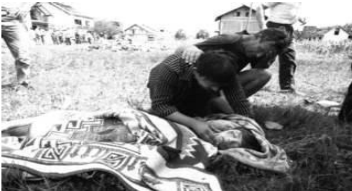
5. Dijete poginulo u ratu. Srpski avioni tzv. JNA bombardirajući Slavonski Brod, pogodili su obiteljsku kuću u kojoj je poginulo petero djece i dvoje odraslih.