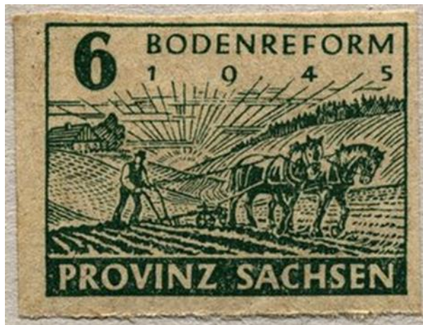
Abbildung 4 Briefmarke zur Bodenreform in der Provinz Sachsen 1945

Strittmatter hat in seinen Werken immer auf die reale Welt zurückgegriffen. So war auch die Bodenreform, die als das Neue, das Böse im Roman dargestellt wurde, auch eine wirkliche Situation. Eine große Kraft, auf die der kleine Mensch nicht einwirken konnte. Wegen diesen erheblichen Veränderungen haben viele Menschen ihr Leben, dass sie bis dahin gelebt haben, verloren. Das erlebte auch der alte Kraske, er verlor alles, das Neue hat ihn überrumpelt.