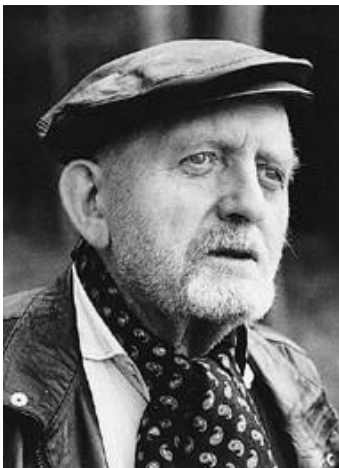
Abbildung 1 Erwin Strittmatter

Erwin Strittmatter ist ein sorbisch- deutscher Schriftsteller, geboren am 14. August 1912 in Spremberg. Er gilt als einer der bekanntesten Schriftsteller der damaligen