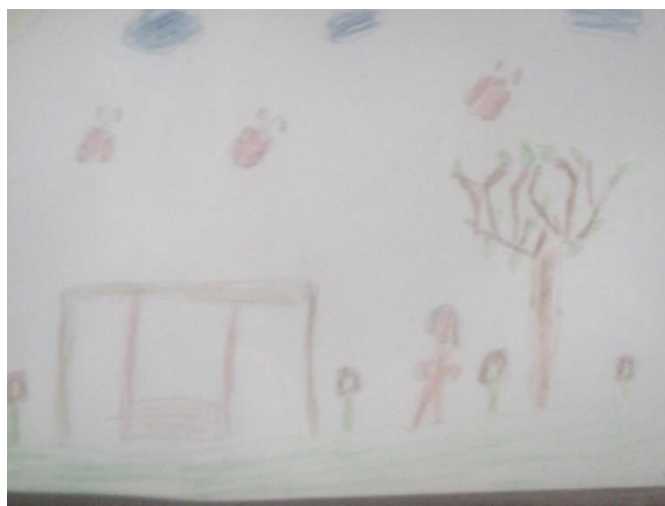
Slika 7. Najdraže mjesto za igru

Na početku radionice pozdravila sam učenike i kroz opušten razgovor upitala ih kako su, jesu li se naspavali, na koji su način došli u školu. Ovakvim uvodom sam željela učenicima poslati poruku da njihove osjećaje i raspoloženje stavljam u prvi plan i da me iskreno zanima što imaju za reći. Također sam im pitanjem o načinu dolaska u školu najavila temu kojom ćemo se baviti. Saznala sam da većina učenika ovoga razreda u školu dolazi kombijem koji ih pokupi pred kućom i doveze u školu ili ih u školu dovozi jedan od roditelja.