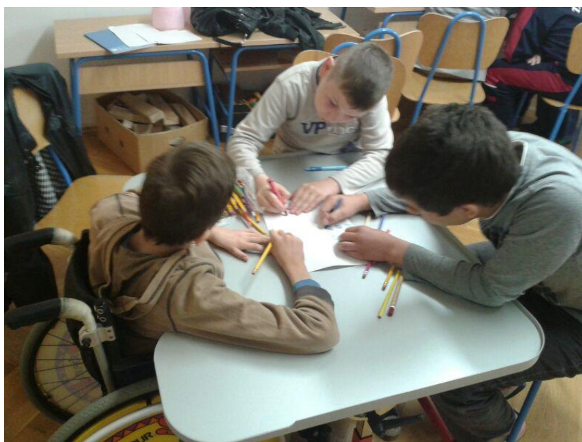
Slika 11. Učenici crtaju igralište

U glavnoj aktivnosti učenike sam podijelila u grupe po četvero i svaka grupa je dobila papir A4 formata. Cilj ove aktivnosti bio je da se učenici uče međusobnom dogovoru i suradnji kako bi postigli zajednički cilj. Ovu aktivnost sam utemeljila na kooperativnom zakonu međusobne ovisnosti. Učenici su unutar grupe trebali surađivati, komunicirati, uvažavati tuđe mišljenje, a ujedno poštivati temeljne humane vrijednosti: prijateljstvo, suradnju, solidarnost, pravednost i nenasilje. Na ploču sam nacrtala prikaz papira i objasnila im što trebaju učiniti: Svake grupa je trebala podijeliti poslove i zajedno nacrtati igralište. Jedan je učenik trebao bojati a drugi crtati neke elemente koji se nalaze na igralištu (Slika 11).