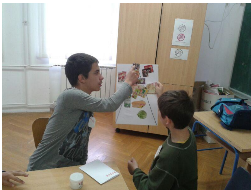
Slika 3. Predstavljanje piramide zdrave prehrane

U razgovoru s nastavnicom Martinom o učeniku M.R. saznala sam kako je za njega sasvim normalno da odbija sudjelovati u aktivnostima te je prema njemu potrebno zauzeti stroži stav u suprotnom se neće uključiti u aktivnost i dodatno će ometati aktivnost ostalih učenika.