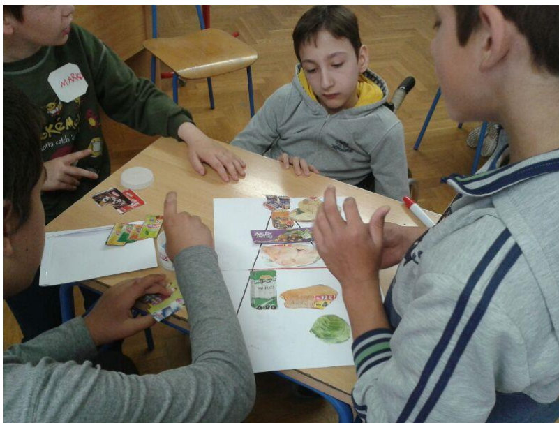
Slika 2. Učenci izrađuju „Piramidu zdrave prehrane“

Kako bih pomogla učenicima, na ploču sam im nacrtala shematski prikaz piramide zdrave prehrane, s točno obilježenim mjestima gdje koja namirnica stoji. Tijekom rješavanja zadatka imali su problema prilikom rangiranja i lijepljenja namirnica. Neki učenici nisu sudjelovali nego su samo sjedili unutar skupine (Slika 2). Bili su opterećeni time da svaku namirnicu stave na točno mjesto i bojali su se zalijepiti sličicu. Ono što sam zamijetila tijekom ove aktivnosti zabilježila sam u svoj istraživački dnevnik: