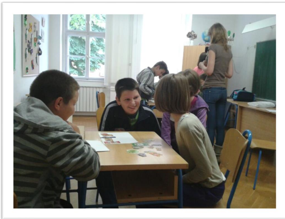
Slika 1. Učenici biraju namirnice koje će kupiti

Tijekom ove aktivnosti promatrala sam učenike kako bi dobila potpuniju sliku o njihovom doživljaju, interesu i posvećenosti učenju. Zamijetila sam kako im je to bilo zanimljivo i kako su se međusobno dogovarali oko izbora namirnica što je bio dobar znak.