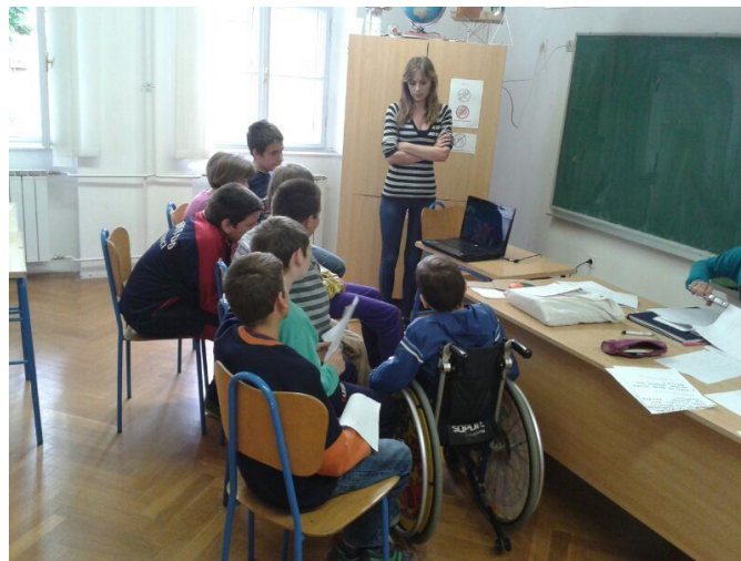
Slika 9. Učenici gledaju crtani film

Kao završnu aktivnost pripremila sam učenicima kratki crtić (Slika 9) u kojemu je istaknuto kako bi se djeca trebala igrati na igralištima i kako blizina ceste nije mjesto za igru.