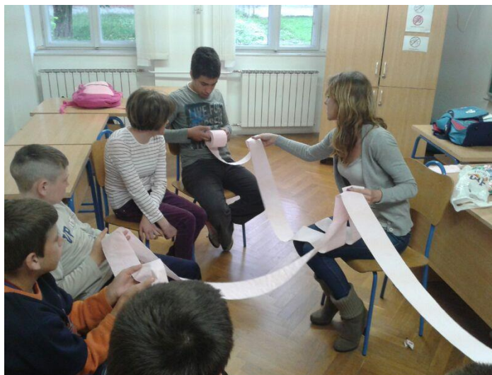
Slika 10. Aktivnost "Krug povjerenja"

Djeca su s lakoćom shvatila zadatak. Bilo mi je drago što su pažljivo slušali moje upute i što su vrlo oprezno prosljeđivali toaletni papir kako listovi ne bi pukli. Također sam zamijetila da su na početku odmah prosljedili rolu prijatelju pored kojega sjede, ali su se kasnije oslobodili i počeli dodavati papir i udaljenijim prijateljima.