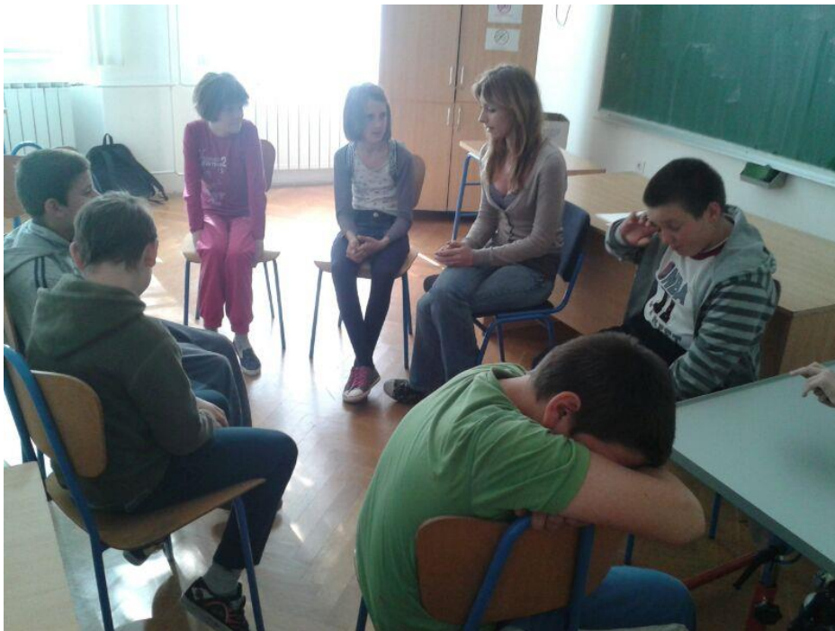
Slika 5. Razgovor o svađi (jedan učenik se isključuje iz kruga okretanjem leđa)