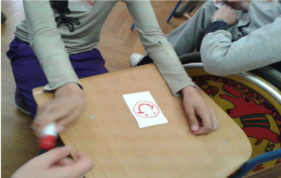
Slika 4. Primjer evaluacijskog listića

Na kraju, učenici su ispunili evaluacijski listić. Trebali su nacrtati sretnog smajlića ukoliko su zadovoljni radionicom, neodlučnog smajlića ukoliko im je radionica bila obična i nije im se pretjerano svidjela i na kraju tužnog smajlića ukoliko im se radionica nije svidjela i nisu ništa naučili. Primjer smajlića sam im nacrtala na ploču i svi učenici su nacrtali sretnog smajlića iz čega sam zaključila da im se radionica svidjela (Slika 4).