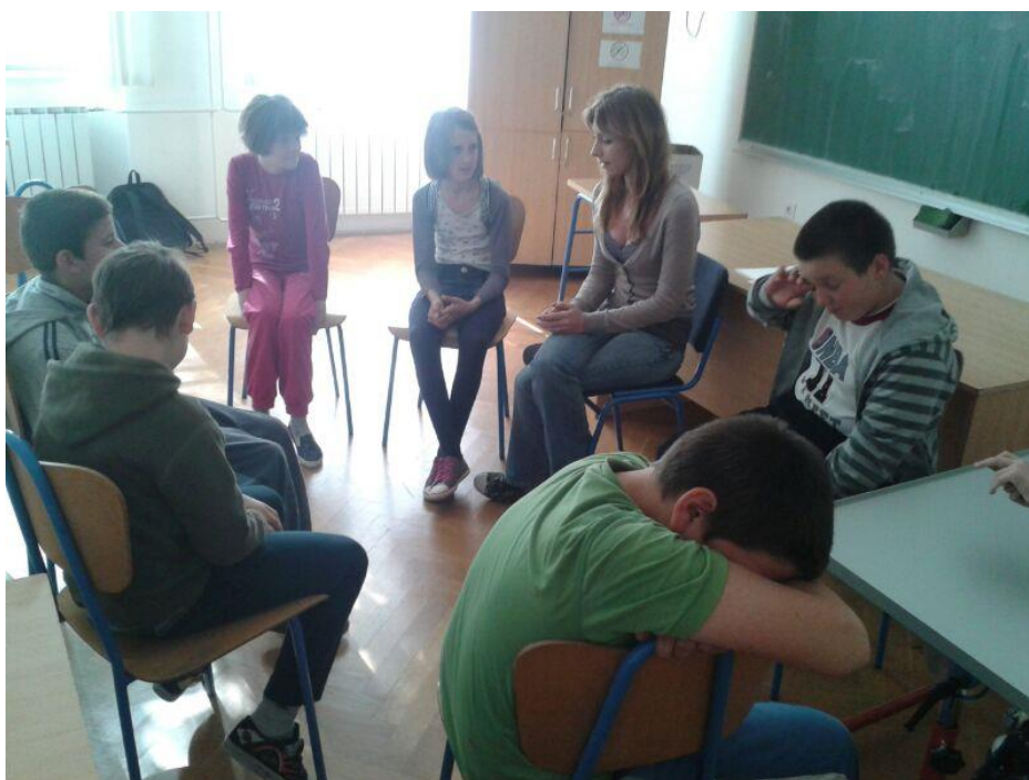
Slika 5. Razgovor o svađi (jedan učenik se isključuje iz kruga okretanjem leđa)