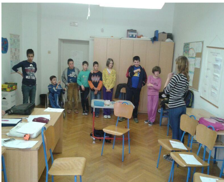
Slika 8. Igra „Crveno- zeleno“

Nakon što su učenici završili sa svojim radovima rekla sam neka ih svima pokažu i objasne što predstavljaju. Kada bi učenik pokazao svoj rad, pitala bih ga gdje se to mjesto nalazi i ima li cesta u blizini toga mjesta. Nakon što su svi pokazali svoje radove, zaključila sam kako su sva mjesta u blizini prometnica pa sam ih pitala znaju li nešto o pravilima ponašanja u blizini ceste. Učenici su počeli govoriti kako moramo paziti kada prelazimo cestu, moramo paziti da nas auto ne pogazi, moramo gledati lijevo i desno kada prelazimo cestu. Uvidjela sam kako učenici znaju puno o ovoj temi i pohvalila njihovo znanje. Za sljedeću aktivnost pripremila sam model semafora za pješake koji sam sama izradila i pokazala sam ga učenicima. Upitala sam ih što znači crveno i zeleno svjetlo na semaforu. Svi učenici znali su da, ukoliko je upaljeno crveno svjetlo, moraju stati, a ukoliko je upaljeno zeleno svjetlo, mogu prijeći cestu.