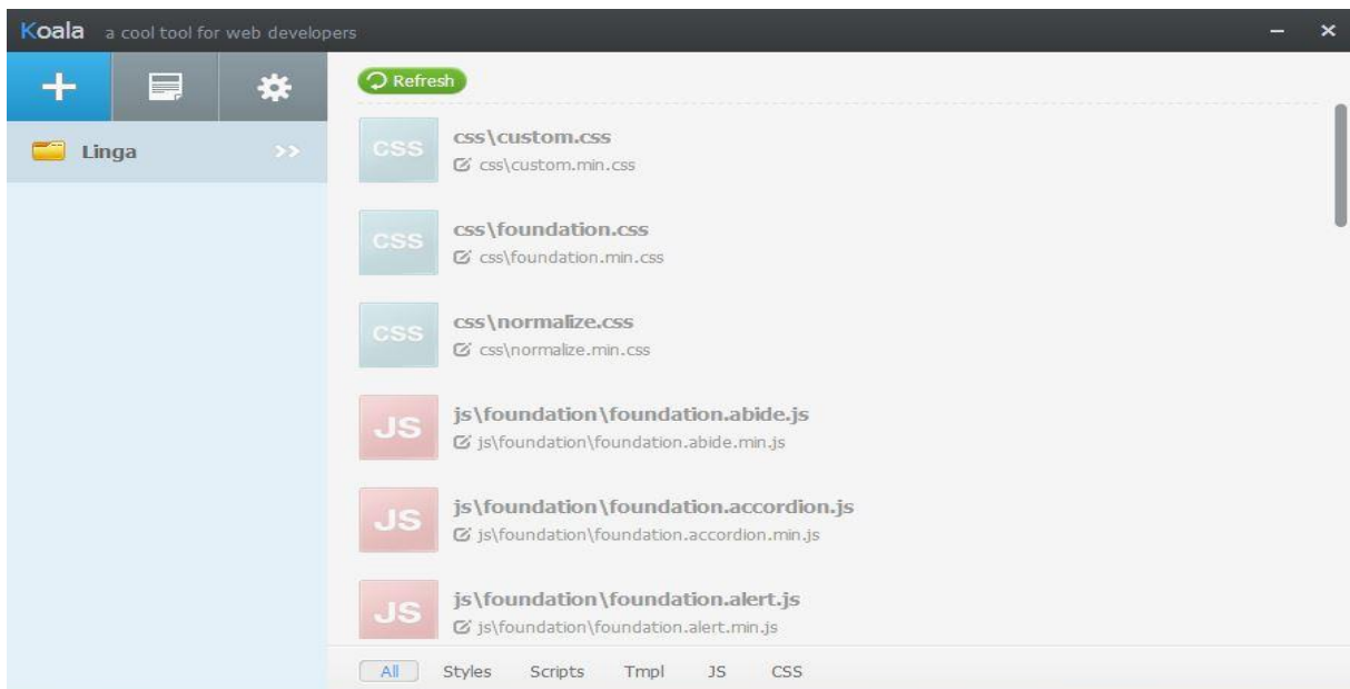
Slika 3 - Koala nakon dodavanja mape projekta

Sama aplikacija poprilično je jednostavna i jedini korak koji je potrebno poduzeti s Koalom jest dodavanje mape projekta sa svim pripadajućim datotekama. Nakon dodavanja mape projekta, sve datoteke koje Koala nadgleda prikazane su u prozoru aplikacije.