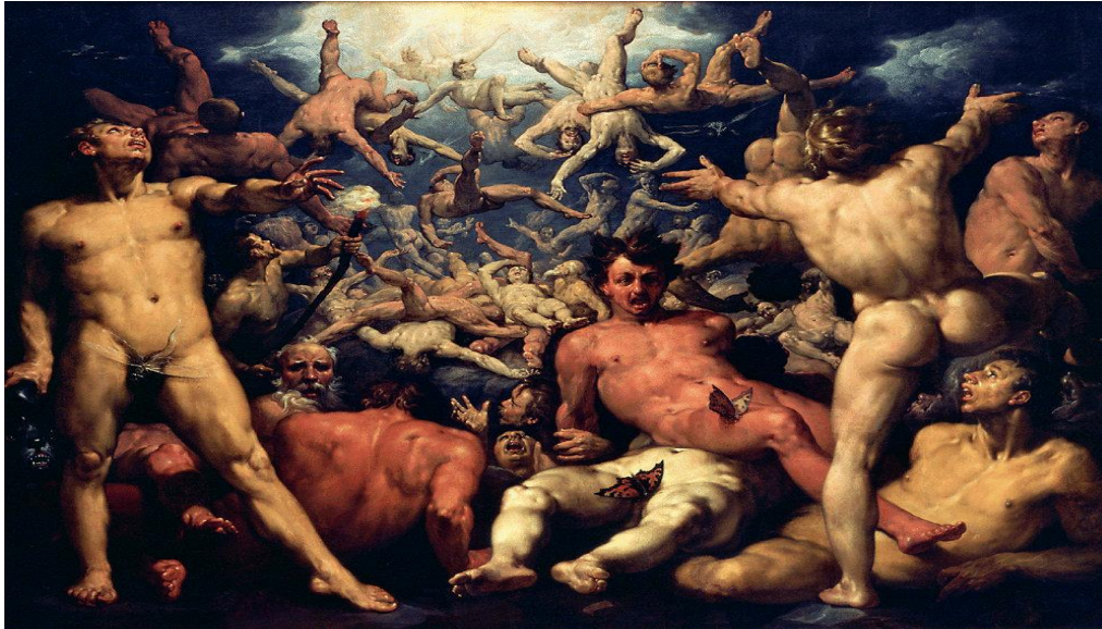
Slika 2. Cornelis van Haarlem: Pad Titana, 1588. 26

U pogledu klasične umjetnosti i svijetu starih bogova ističu se elementi prirode koji zatamnjuju duhovnost. Zato je u duhovnom pogledu tu još uvijek sve nejasno, mutno. Tomu nasuprot, u svijetu novih bogova ističu se elementi duhovnosti kao slobodne individualnosti: