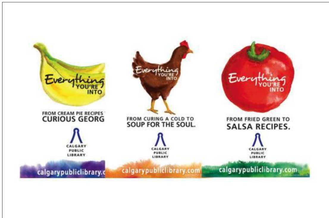
Slika 2. Neki od slogana koji su u sklopu knjižnične kampanje bili postavljeni u trgovinama

Nadalje, Calgary Public Library iz Kanade, prva je narodna knjižnica na tom području koja se okušala u primjeni gerila marketinga za predstavljanje svoje knjižnice i njezinih usluga. Za provođenje svoje kampanje, kanadska knjižnica odabrala je supermarketu u Calgaryju. Ova jedinstvena kampanja pod nazivom „Everything You're Into" cilja na kupce Real Canadian Superstore-a na način da postavljeni pametni oglasi diljem trgovina utječu na ljude kako bi promislili o knjižnici tijekom obavljanja kupovine. Knjižnica polazi od stava da posjeduje za svakoga po nešto te je odlučila šokirati kupce jednostavnim oglasima koji spajaju robu koju kupuju s određenim naslovima knjige. Oglasi su postavljeni unutar svih deset trgovina koje pripadaju istom trgovačkom lancu, a sadržavali su slogane poput „Od roštilja do bika za jahanje“ i „Od recepata za kremaste pite do Znatizeljnog Georga“ (slika 2). Ovakvi oglasi postavljeni su, osim u trgovinama, i po autobusnim stanicama te javnim toaletima diljem Kanade. 33 Korištenjem neobičnih slogana, na kupce se utječe na način da se pobudi želja za saznavanjem što, primjerice, recepti za kremaste pite i naslov „Znatizeljni Georg“ imaju zajedničko. Tako se potiče na veće korištenje same knjižnice od strane njezinih korisnika, ali isto tako se potencijalne korisnike potiče na učlanjenje u knjižnicu i korištenje njezine građe i usluga.