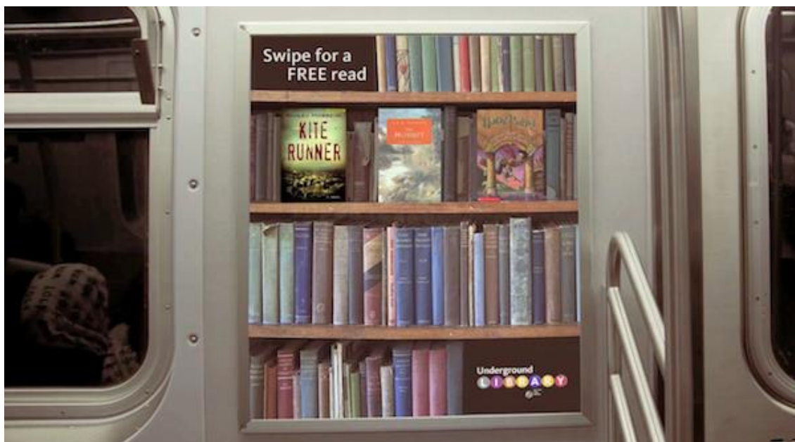
Slika 1. Prikaz jedne od „polica“ s knjigama u podzemnoj željeznici u New Yorku