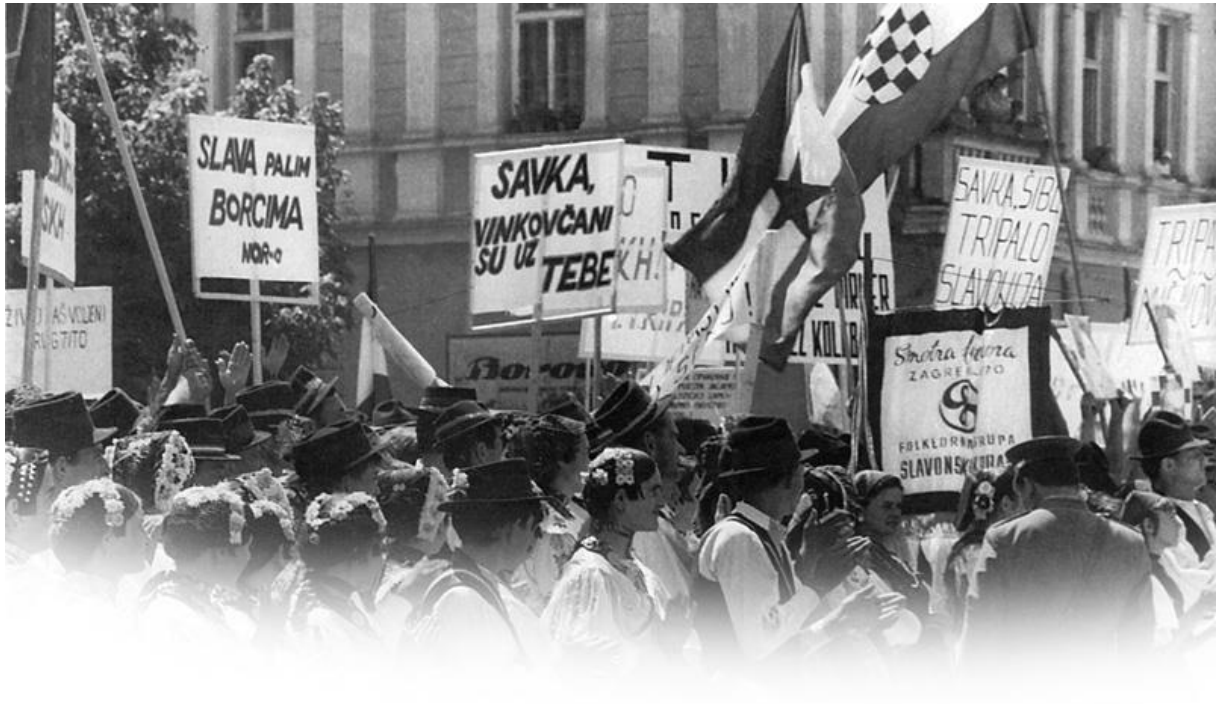
Prilog 2. Veliki javni skup u Slavonskom Brodu u srpnju 1971. godine