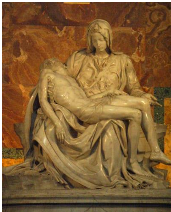
Slika 2. Pietà