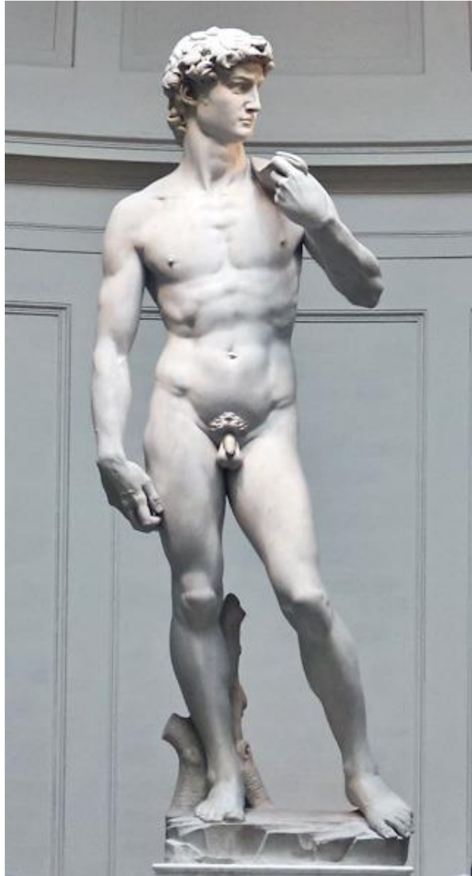
Slika 3. David