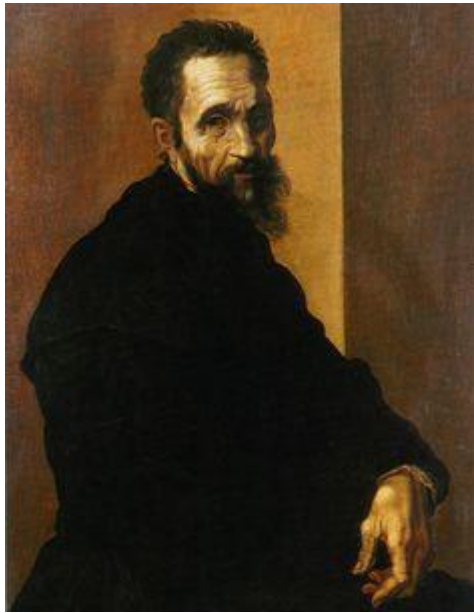
Slika 1. Michelangelov portret