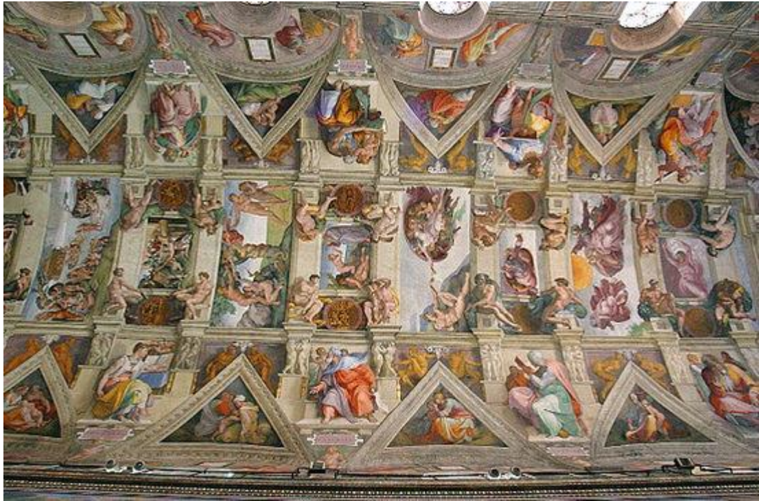
Slika 4. Svod Sikstinske kapele