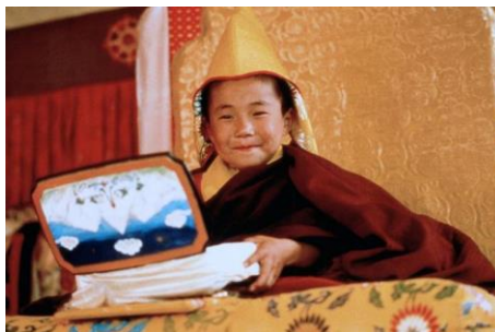
Bild 15 Froschperspektive

Bei dieser Perspektive ist die Kamera so positioniert, dass der Zuschauer den Eindruck erhält auf die Personen und Gegenstände im Film heraufzusehen. Damit erreicht der Kameramann beispielsweise eine Person als mächtig wirken zu lassen.