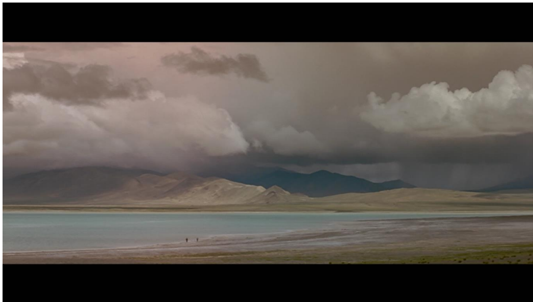
Bild 6 Weit

Hier legt man keinen großen Wert auf Einzelheiten: oft werden dabei die Welt und die Natur dargestellt. Diese Einstellung gilt als gefühlvoll und symbolisiert oft auch etwas, stets wird sie durch Musik im Hintergrund betont. 36