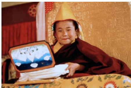
Bild 15 Froschperspektive

Bei dieser Perspektive ist die Kamera so positioniert, dass der Zuschauer den Eindruck erhält auf die Personen und Gegenstände im Film heraufzusehen. Damit erreicht der Kameramann beispielsweise eine Person als mächtig wirken zu lassen.