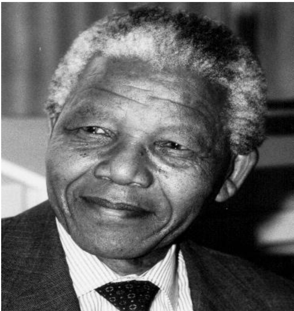
Slika 2: Nelson Mandela