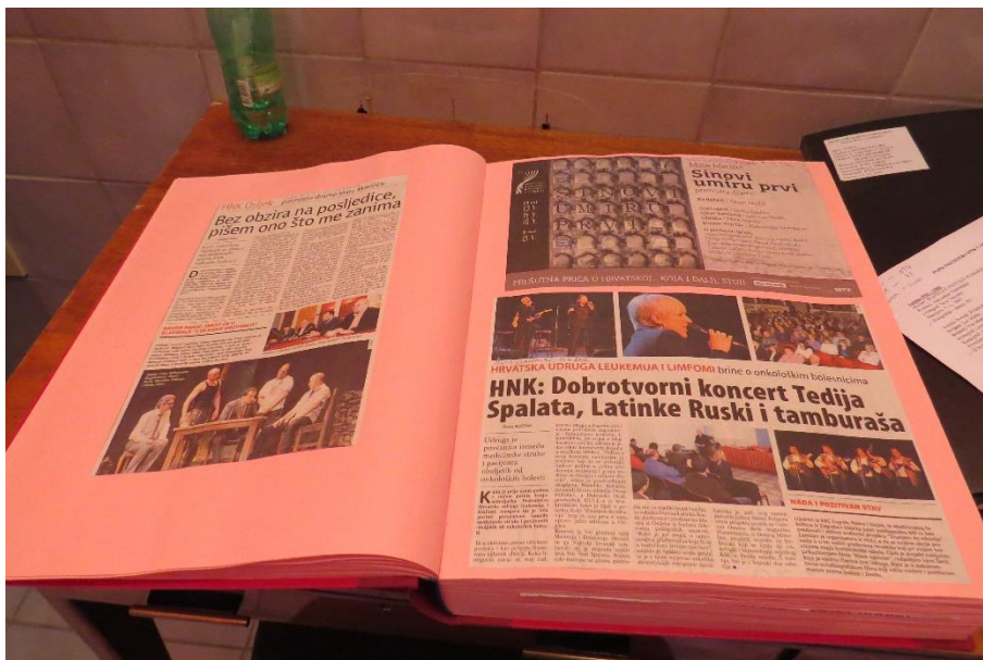
Fotografija 8. Slika uvezane knjige press clippinga