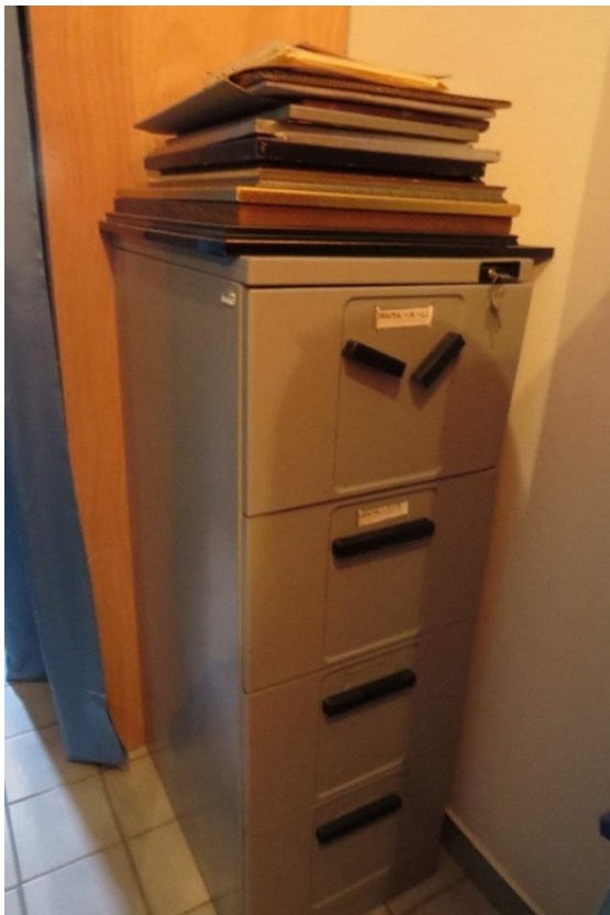
Fotografija 6. Slika jedinog metalnog ormara