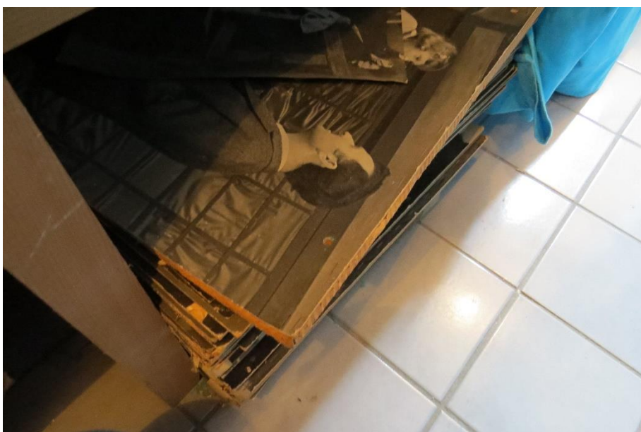
Fotografija 7. Kaširane fotografije