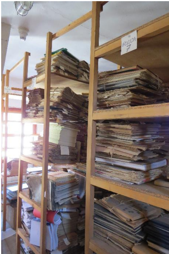
Fotografija 2. Slika prostorije na tavanu sa građom dramskih djela