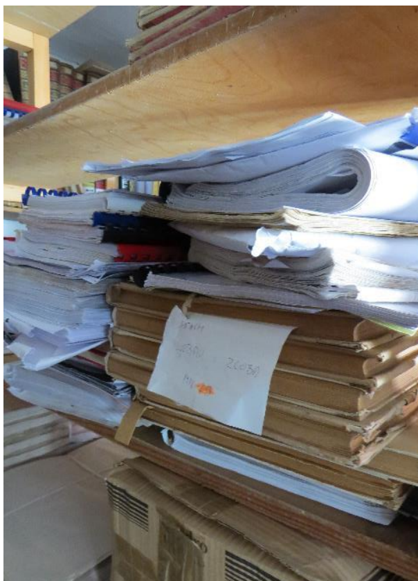
Fotografija 4. Slika građe u prostoriji s notnim zapisima