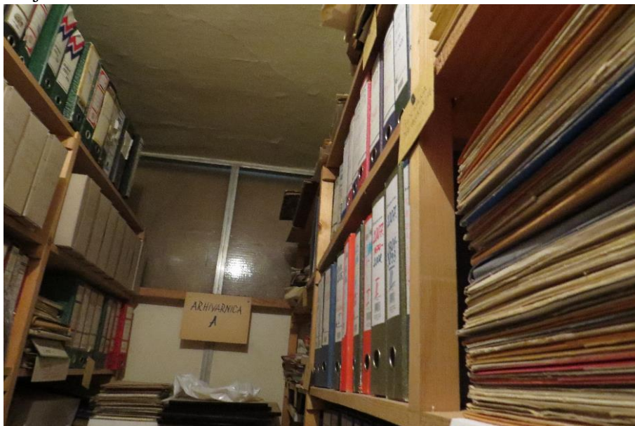
Fotografija 1. Slika arhivarnice pored ureda intendanta

Prilog 1. Fotografije arhivske građe i prostora u Arhivu Hrvatskog narodnog kazališta u Osijeku 64