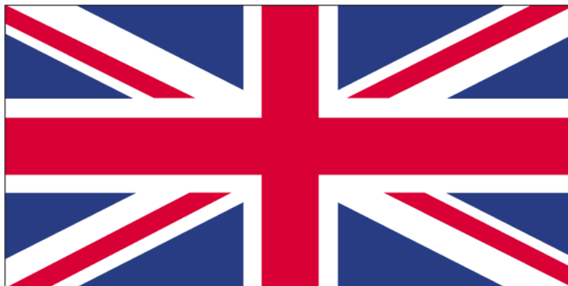
Slika 1. Slika zastave Ujedinjenog Kraljevstva

Može se vidjeti na zastavama Australije, Novog Zelanda te otočja Fidži i Tuvalu, ali i na zastavi Američke savezne države Havaji, iako oni nikada nisu bili u posjedu Velike Britanije. 27