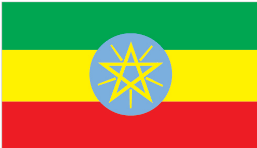
Slika 2. Slika zastave Etiopije

poneke razlike. Tako kod zastave Gane, zelena boja predstavlja šume i prirodne ljepote, dok primjerice ista boja na zastavi države Senegal predstavlja Islam, ali i nadu i napredak. 29