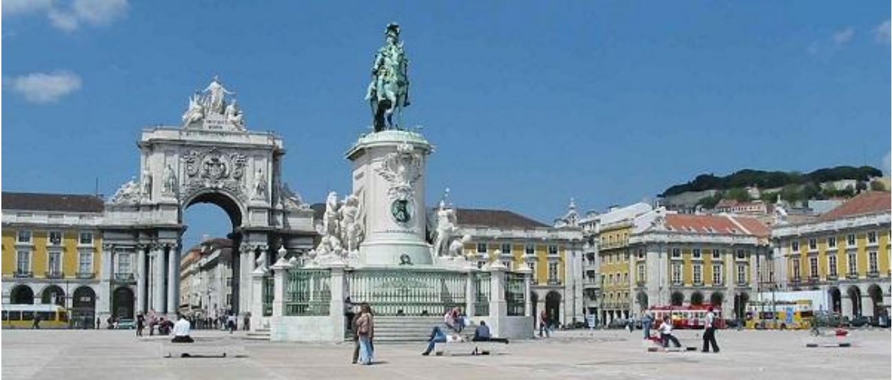
7. Konjanički kip Josipa I. i Trijumfalni luk na trgu Praça do Comércio