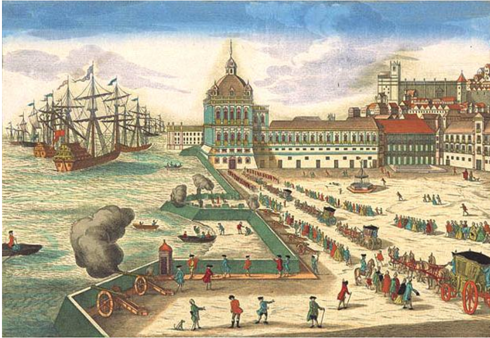
5. Proces reizgradnje lisabonskog centra uz rijeku Tejo