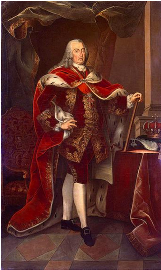
3. Portret kralja Josipa I.