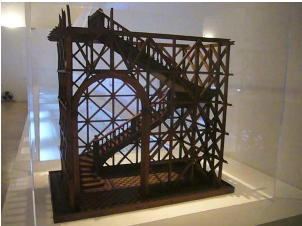
8. Drvena konstrukcija pombalinskog kaveza