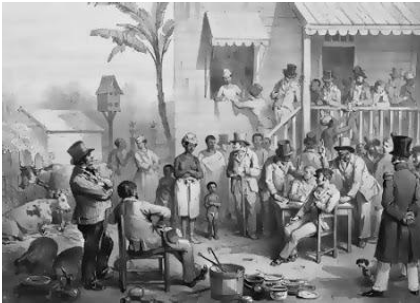
4. Trgovina robljem u 18. stoljeću