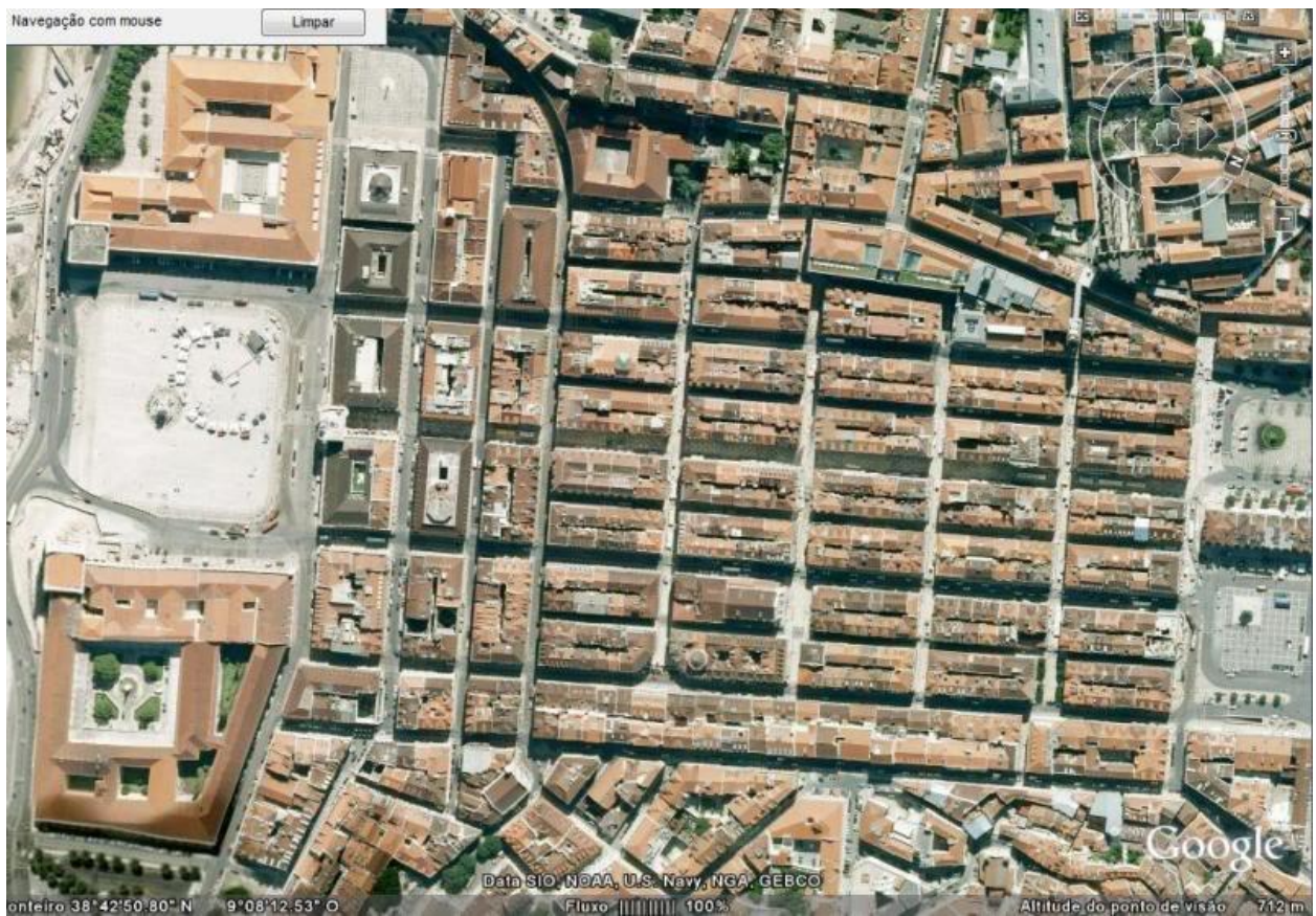
6. Pravilne ulice i blokovi Baixa Pombalina