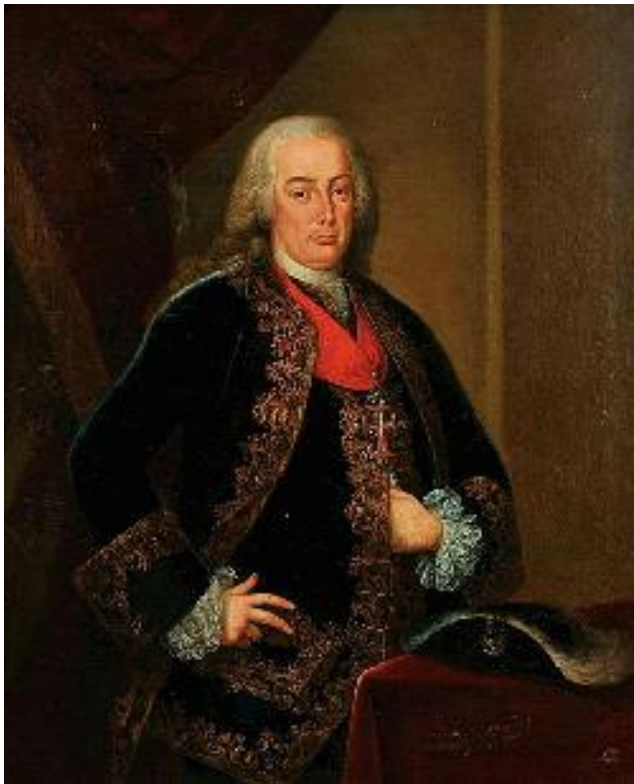
2. Portret markiza od Pombala