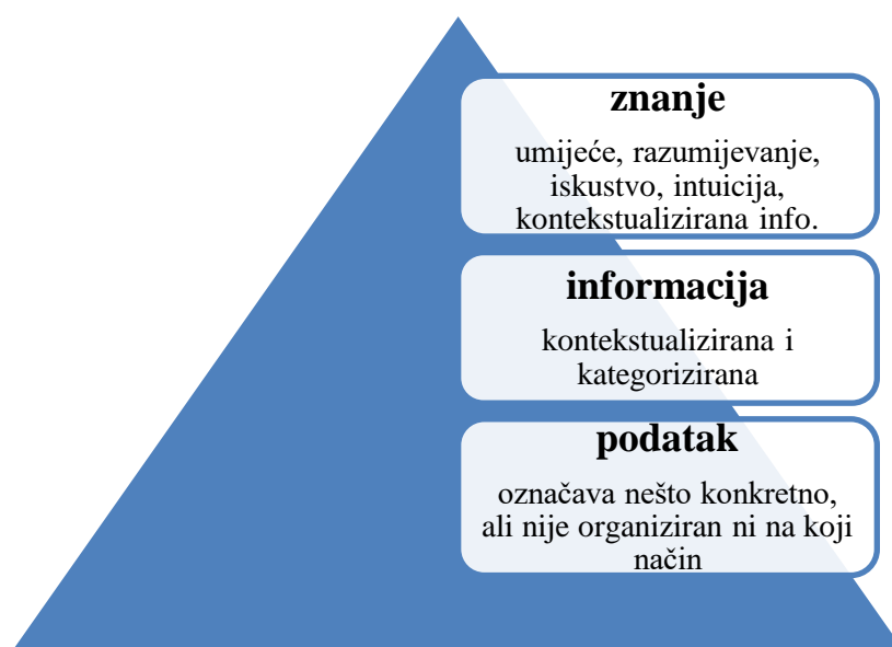
Slika 1. Prikaz pojmova i definicija „podatak – informacija – znanje“ kroz piramidu 26

U svakodnevnom govoru, od tri pojma najviše koristimo pojam „znanje“. Koristimo ga referirajući se na umijeće, ali i na mudrost. Često „znanje“ brkamo s „informacijom“, a unatoč povezanosti ta tri koncepta (podatak – informacija – znanje), oni nemaju jednako značenje, već jedan nastaje iz drugoga, odnosno iz trećega.