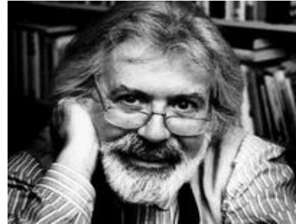
1. Michael Ende 3