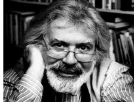
1. Michael Ende 3