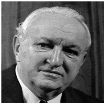
Slika 1. Vladimir Bakarić

Nakon ulaska partizanskih snaga 8. svibnja 1945. u Zagreb, stigla je i vlada Federalne Hrvatske na čijem čelu se nalazio Vladimir Bakarić, koja je bila formirana u Splitu već 14. travnja 1945. Uskoro je u Zagreb prešao i ZAVNOH, koji se u srpnju na svom četvrtom zasjedanju preimenuo u Narodni sabor Hrvatske, kao privremeno predstavničko tijelo do konačnog uređenja države. Inače je jugoslavenskom državom upravljala jedinstvena privremena jugoslavenska vlada uspostavljena 7. ožujka 1945., na čelu s predsjednikom Josipo Brozom Titom. Uspostavljeno je bilo i Kraljevsko namjesništvo koje je ukinuto 29. studenog 1945. kada je novoizabrana Ustavotvorna skupština ukinula monarhiju i uspostavila republiku pod nazivom Federativna Narodna Republika Jugoslavija (FNRJ). Zemljom u biti upravlja KPJ, iako to čini preko Narodnog fronta i drugih masovnih organizacija koje su stvarane za sva područja društva, tj. za borce, mladež, djecu, radnike, pa i svećenike (staleška svećenička udruženja). Sve to skupa motrile su političke policije OZN-a i UDB-a. U siječnju 1946. donesen je novi Ustav FNRJ, a u skladu s njim Hrvatska se naziva Narodna Republika Hrvatska. 1