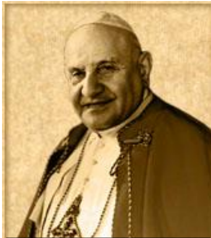
Slika 6. Papa Ivan XXIII.

Dolaskom pape Ivana XXIII. na čelo Katoličke crkve godine 1958. u samoj su se Crkvi osjetili novi vjetrovi, koji su navijestili novo razdoblje. Papa Ivan XXIII, zvani Dobri, je godine 1959. najavio održavanje ekumenskog sabora kojim je želio otvoriti Crkvu i približiti je svijetu. Papa nije želio ni sa kim ratovati i nikoga anatemizirati, nego sa svima uspostaviti dijalog. Papa je želio uspostaviti dijalog ne samo s drugim kršćanskim Crkvama i raznim vjerama, nego i s nevjernicima (ateistima). Takav pristup pape Ivana XXIII. čini se da su sa stanovitim olakšanjem primili i