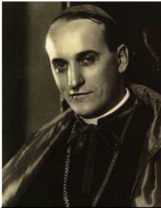
Slika 2. kardinal Alojzije Stepinac

Nepovjerenje između Katoličke crkve u Hrvatskoj i nove komunističke vlasti bilo je obostrano i duboko ukorijenjeno. Svakako je na to imao utjecaj ateistički pogled komunistana svijet. No i program KPJ još iz njene najranije faze djelovanja, iz razdoblja između dva svjetska rata, predviđao je neke poteze u slučaju dolaska na vlast koji se nisu sviđali kako Katoličkoj crkvi tako ni drugim vjerskim zajednicama u tadašnjoj Jugoslaviji. Naime, program KPJ predviđao je odvajanje Crkve od države i škole od Crkve, pljenidbu crkvene imovine, te postupnu eliminaciju Crkve od političkog života. Iako su komunisti tijekom