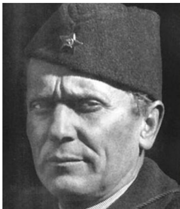
Slika 3. Josip Broz Tito

Poslije brojnih opustošenih samostana i obespastirenih župa, dolaskom partizanskih snaga predvođenih KP-om u Zagreb, postalo je jasno da protuvjerski, a u najmanju ruku protukatolički, elementi dominiraju. Skidanje križeva sa školskih zidova, ukudanje molitve prije početka nastave, oduzimanje bogoštovnih objekata, maltretiranje djece, mladeži i odraslog pučanstva zbog njihove vjere bio je predznak onoga što je trebalo doći. Odmah po dolasku u Zagreb, partijski su rukovodioci oduzeli nadbiskupu Stepincu automobil. Dva dana nakon toga, 17. svibnja 1945., nadbiskup je bio pritvoren i ispitivan. On nije bio jedini svećenik ili biskup kojemu se to dogodilo. 10