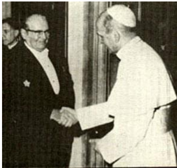
Slika 8. Susret Josipa Broza i pape Pavla VI.

Velik se broj Hrvata Protokolu nije radovao. To se ponajprije odnosi na hrvatsko političko iseljništvo. Hrvatski su emigranti držali da će sada jugoslavenski režim protiv njih voditi uspješniju borbu. A i u domovini su mnogi bili sumnjičavi prema tom potezu Svete Stolice. Danas možemo reći da je uspostava diplomatskih odnosa imala dobre, a i neke loše posljedice. Među dobre posljedice, između ostaloga, spada i lakše dobivanje građevinskih dozvola za izgradnju crkvenih objekata. Svakako, uspostavom diplomatskih odnosa nisu se obistinile crne slutnje onih koji su mislili da će režim Crkvu podrediti svojim interesima, na štetu hrvatskih svećenika i vjernika. 108