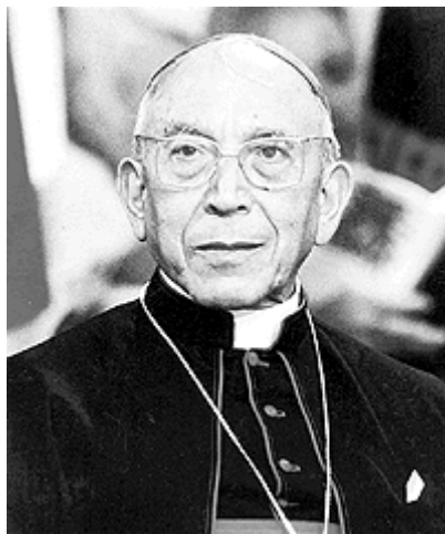
Slika 7. Agostino Casaroli

Protokol sa SFRJ, prema riječima državnoga tajnika kardinala Viollota, ne predstavlja za Crkvu u Jugoslaviji modus vivendi nego prije modus non moriendi . Ovakva je politika bez sumnje pridonosila priznanju i u izvjesnome smislu međunarodnomu ugledu jugoslavenskoga režima, ali je nisu prihvaćali ni vjernici ni biskupi. 95