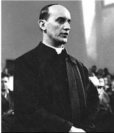
Slika 4. suđenje kardinalu Stepincu

Opće je poznata činjenica da je komunistička Jugoslavija, kao i ostale socijalističke zemlje Istočne Europe vrlo energično tražila i osuđivala "ratne zločince". Među takve su uvrštavani i oni koji s ratnim zbivanjima, a posebno s "ratnim zločincima", nisu imali nikakve veze. Važna je činjenica da nadbiskup Stepinac neposredno nakon završetka rata nije odmah izveden pred sud ako, što je čudno se radilo o "ratnom zločincu". 32