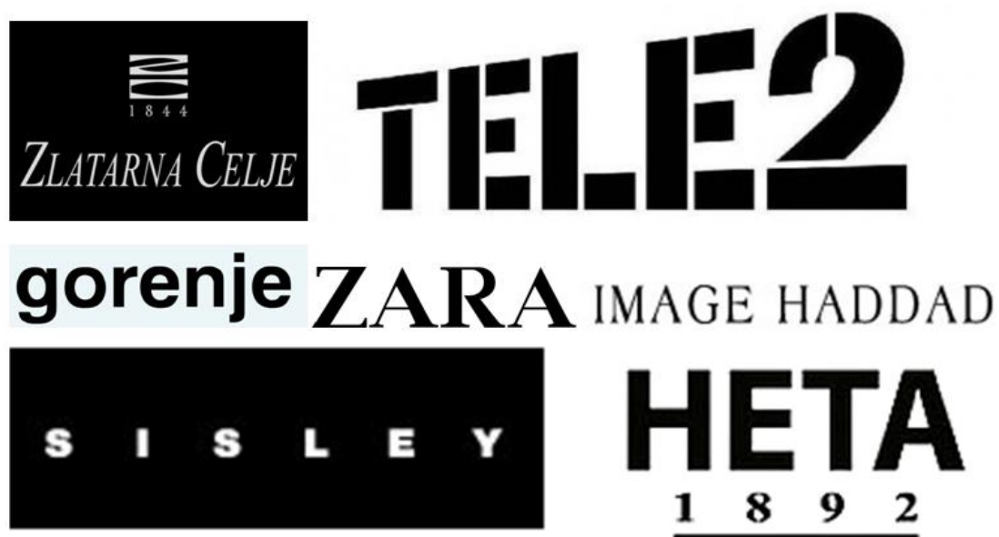
Slika 4. Primjeri korištenja crne boje u izradi logotipa