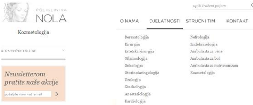
Slika 6. Primjer korištenja bijele boje u stvaranju vizualnog identiteta