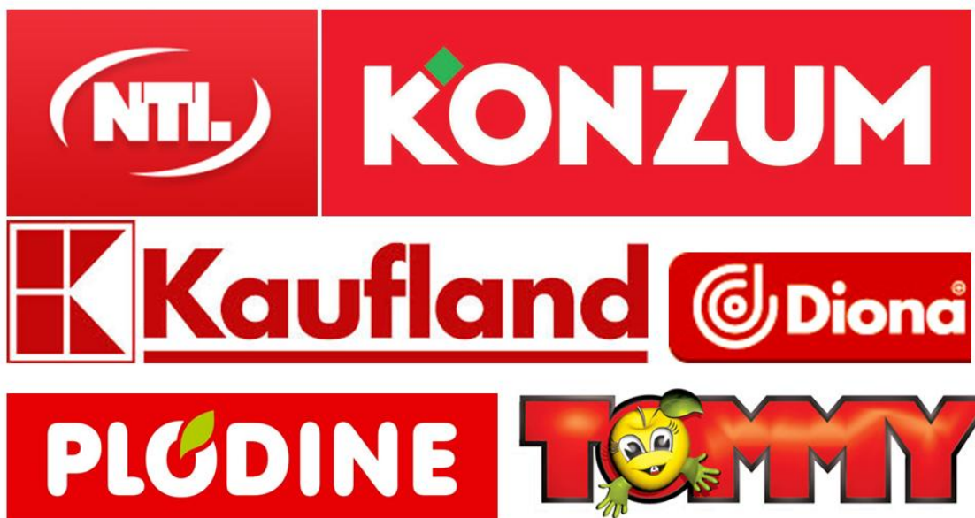
Slika 2. Primjeri korištenja crvene boje u izradi logotipa