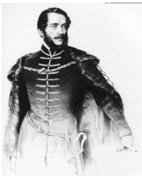
Prilog 1. – Lajos Kossuth