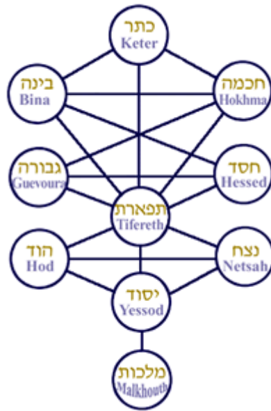
Prilog 3. Drvo života prikazano u kabali