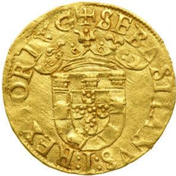
Prilog 6. Portugalski zlatni novac-cruzado