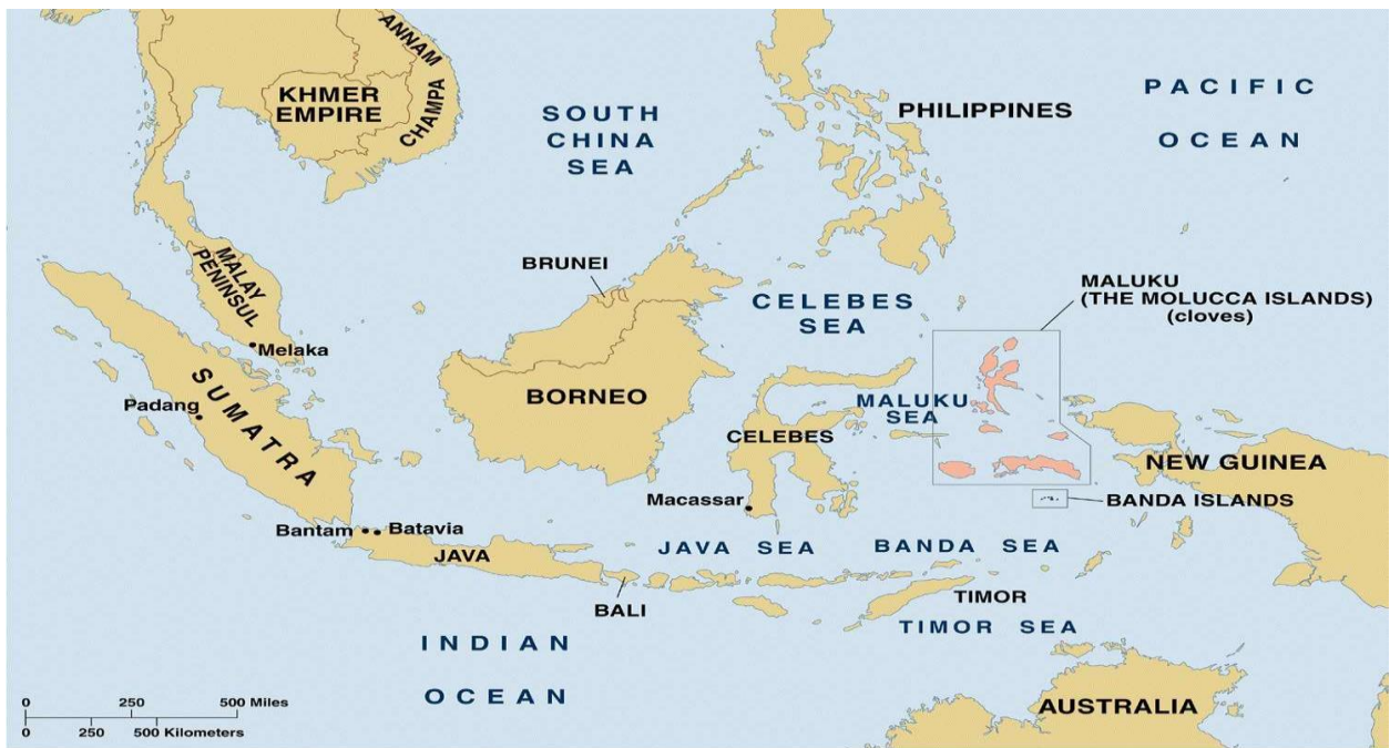
MAP 1-6 THE SPICE ISLANDS IN SOUTHEAST ASIA