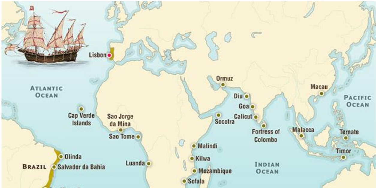
Prilog 4. Portugalska ekspanzija