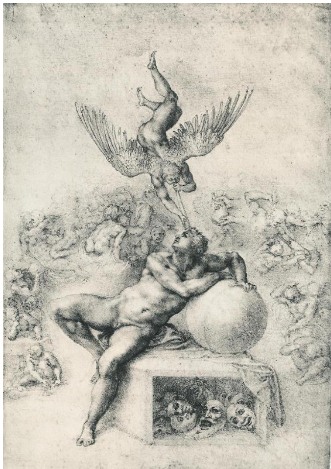
Prilog 2. Michelangelo, slika San ljudske taštine

Druga slika je San ljudske taštine ili The Dream of Human's Life . Autor slike je Michelangelo Buonarroti. Nastala je 1533. godine. Ona je Michelangelov ikonografski crtež. Tradicionalno se tumači kao alegorija vrline i poroka, odnosno moralne poduke. Alegorija predstavlja borbu između intelekta i strasti ili proslavu pročišćavanja snage ljubavi. Nag mladić spava s glavom naslonjenom na globus, napada ga anđeo s krilima, svirajući trubu. Ispod globusa nalazi se kolekcija maski - moguće da prikazuju iluzije ili snove - dok je mladić okružen skupinom koja moguće da prikazuje sedam smrtnih grijeha. Jasno se vidi pet poroka, a to su proždrljivost, putenost, pohlepa, lijenost i gnjev. Ostala dva grijeha, zavist i ponos, slabo se može identificirati. Ljepušasti mladić pozvan je trubom kako bi napustio svoj život poroka te se ugledao u nebo za svoje spasenje. (Toman, 2005:439)