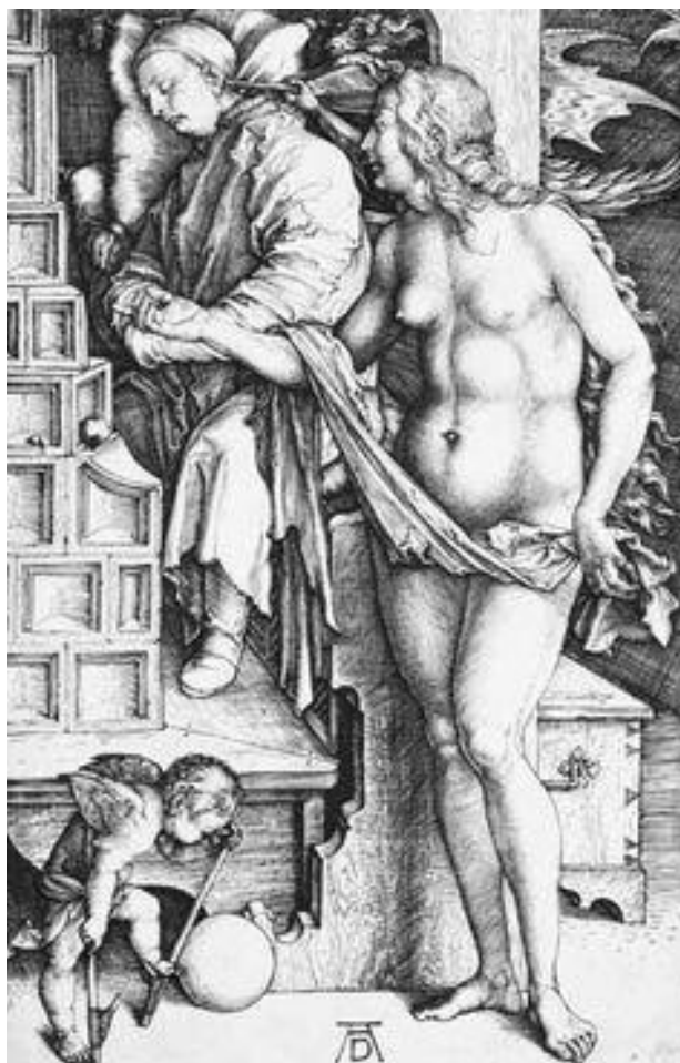
Prilog 4. Albrecht Dürer, Učenjakov san

Četvrta slika je Solomonov san . Autor slike je talijanski umjetnik Giordano Luca. Slika je nastala 1693. godine. Primjer je za barokno shvaćanje sna. Slika prikazuje Solomona, izraelskog kralja i Davidovog sina. Bio je poznat po svojoj posebnoj mudrosti, razboritosti i pravednosti te gradnji hramova u božju čast. Slika je nastala prema legendi koja govori kako je Solomon, kada je zaspao u svojem krevetu, imao božansku viziju i molio je Boga da mu podari razumno srce da pravedno vlada svojim narodom te da on može raspoznati i razlikovati dobro i zlo i tako suditi ljudima. Bog mu se javio i bio je zadovoljan njegovom molbom i time što nije tražio duži život, smrt svojih neprijatelja ili materijalno bogatstvo. Ostvario mu je ono što je Solomon želio, ali mu je dao i ono što nije tražio, bogatstvo i čast i dugi život.