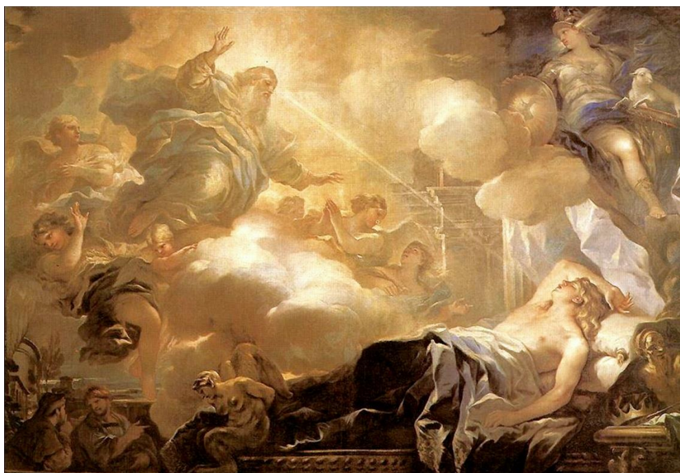
Prilog 5. Luca Giordano, Solomonov san

prikazana je Minerva, rimska božica mudrosti, glazbe, poezije, medicine, magije, koja će inspirirati Solomona u njegovim odlukama i presudama. Ona ovdje predstavlja pretkršćansku figuru i drži kod sebe janje, simbol mogućeg Kristovog dolaska te knjigu, simbol Biblije, svete knjige. Može se uočiti i figura Fauna, rimskog mitološkog bića, koji se odmara kraj Solomonove krune. Smatra se kako Faun nesvjesno može prenijeti mudrost. Na slici također prevladavaju prigušene boje koje promiču sanjivo raspoloženje slike. Solomon je prikazan kao izrazito lijep, no snažan mladić, čime je izražena i njegova snažna i emotivna strana. To su kvalitete koje svaki pravedan i dobar vladar mora posjedovati. 31