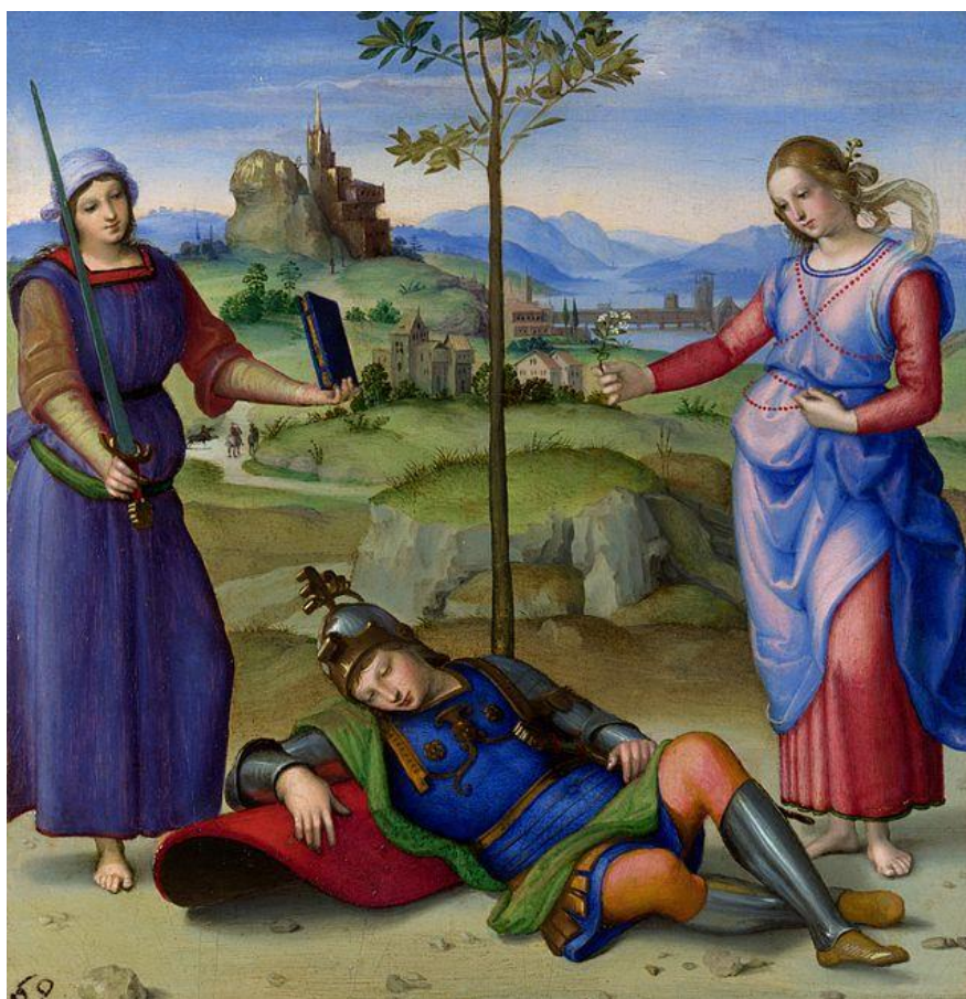
Prilog 1. Rafael, slika Vitezov san

okružen je dvjema ženama. Jedna žena u rukama drži knjigu i mač, a druga cvijet. Pejzaž u zadnjem planu slike predstavlja talijanski grad na istoku, Urbino. Postoji nekoliko teorija tumačenja ove slike. Neki povjesničari umjetnosti smatraju kako ona prikazuje uspavanog kralja koji je zapravo rimski general Scipion Afrički (236.-184. Pr. Kr.). On je zaspao ispod drveta i u snu je vidio dvije žene, Vrlinu i njezinu suparnicu Užitak. Vrlinu predstavlja žena s kraljeve lijeve strane. Jednostavnije je odjevena, ima mušku figuru i kosu. Ona obećava Scipionu duboko poštovanje i slavu pobjede u ratu, no upozorava kako je taj put prema njezinom samostanu na vrhu brijega kamenit i težak. Užitak, s mirisnim i glatkim loknama te tamnim očima, predlaže lak i bezbrižan život. Kralj u svojem snu mora odlučiti između dvije vrijednosti. Sugerira se kako je put Istine puno teži, ali donosi više toga. Također, žene mogu predstavljati kraljeve idealne atribute - knjigu, mač i cvijet. To jesu simboli koji predstavljaju ideale intelektualca, vojnika i ljubavnika koje idealni kralj mora posjedovati. Smatra se kako je alegorija preuzeta iz poeme „Punica“ koja tematizira Drugi punski rat, latinskog pjesnika Siliusa Italicusa. (Toman, 2005: 335)