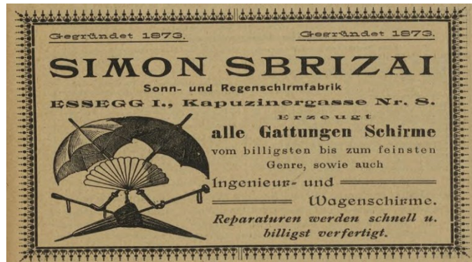
Werbetext 1 (Essegger Bote, 1914) 1

Das erste Exemplar eines Werbetexts aus dem illustrierten Kalender Essegger Bote ist „Simon Sbrizais Sonn- und Regenschirmfabrik, Essegg 1. Kapuzinergasse Nr. 8“ (ebd.). Damit erfüllt bereits der erste Werbetext die Informationsfunktion, welche „über die Existenz und Beschaffenheit des Produktes informiert“ (Stein 2011: 37), indem er das Produkt explizit genannt hat. Das Produkt wurde auch im Werbetext beschrieben, wobei es bildlich gezeigt wurde. Mit der Information, dass die Fabrik „alle Gattungen Schirme erzeugt“ (ebd.) – und unter dem sind „vom billigsten bis zum feinsten Genre, sowie auch Ingenieurs- und Wagenschirme“ (ebd.) gemeint – hat diese ihre Produkteigenschaften aufgezählt. Die Werbung hat auch ihre Anwendungsmöglichkeiten aufgezeigt, bzw. ihre Verwendungssituationen genannt, welche sich im Namen des Betriebs der Fabrik selber verbargen: „Sonn- und Regenschirmfabrik“ (ebd.).