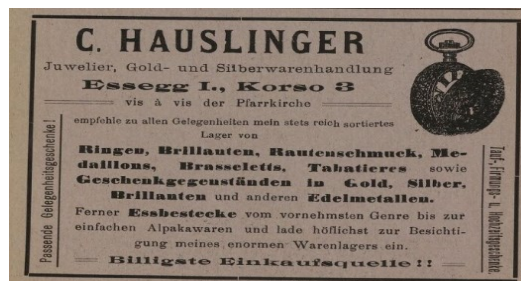
Werbetext 5 (Essegger Bote 1913) 5