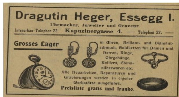
Werbetext 2 (Essegger Bote 1914) 2

Das zweite Exemplar aus dem illustrierten Kalender Bote ist der Werbetext von dem „Uhrmacher, Juwelier und Graveur, Dragutin Heger“ (ebd.) in der „Kapuzinergasse 4, Essegg 1“ (ebd.). Somit ist, auch wie im ersten Exemplar, bereits die erste Informationsfunktion erfüllt. In dem Werbetext beschreibt das Produkt – durch die Aufzählung der Produkteigenschaften und der fallweisen Nennung der Inhaltstoffe – dass: „in Uhren, Brilliant- und Diamantschmuck, Goldketten für Damen und Herren, Ringe, Ohrgehänge, Kolliers, Chinasilberwaren etc. Alle Neuarbeiten, Reparaturen und Gravierungen in eigener Werkstätte ausgeführt“ werden (ebd.). Der Werbetext von Heger zeigt das Produkt bildlich, womit er auch das Produkt beschreibt. Als Anwendungsmöglichkeiten wird nur die Verwendungssituation aufgezeigt: Die Phrase „für Damen und Herren“ (ebd.) beschreibt die Verwendungssituation, um den gezielten Käufer zum Kauf zu bewegen.