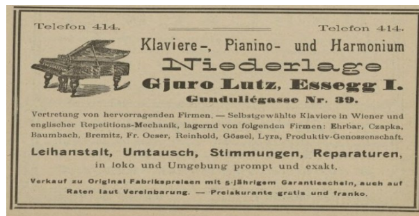
Werbetext 6 (Essegger Bote 1911) 6

Das sechste Exemplar eines Werbetexts aus dem illustrierten Kalender Essegger Bote ist von „Gjuro Lutz“ (ebd.) und seiner „Klaviere-, Pianino- und Harmonium Niederlage“ in der „Gundulićgasse Nr. 39, Essegg 1“ (ebd.). Damit führt der Werbetext den Produktnamen und Hersteller an und so nennt er das Produkt explizit. Für die Produktbeschreibung werden „selbstgewählte Klaviere“ erwähnt und als Produkteigenschaften zählt der Werbetext eine Vielzahl von Firmen auf, welche das Produkt eigentlich produzieren. Das Produkt ist auch durch das Bild eines Klaviers gezeigt, womit der Werbetext erneut das Produkt beschreibt. Als Anwendungsmöglichkeiten zeigt der Werbetext Verwendungssituationen auf, bzw. Lutz bietet „Leihanstalt, Umtausch, Stimmungen [und] Reparaturen“ an. In diesem Exemplar sieht man, dass der Werbetext auch alle Informationsfunktionen erfüllt.