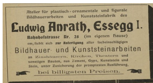
Werbetext 4 (Essegger Bote 1915) 4

Das vierte Exemplar aus dem illustrierten Kalender Essegger Bote ist von „Ludwig Anrath, Essegg 1. Bahnhofstrasse Nr. 28 (im eigenen Hause)“ (ebd.), der mit seinem Produkt „Bildhauer- und Kunststeinarbeiten“ (ebd.) macht. Somit ist in den Werbetexten der Hersteller genannt und