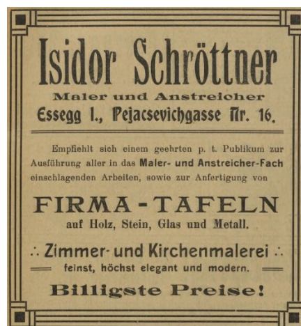
Werbetext 3 (Essegger Bote 1914) 3