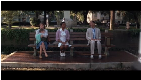
Slika 7 Scena s patikama 57