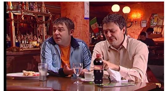
Slika 11 Reklama Konzuma 61