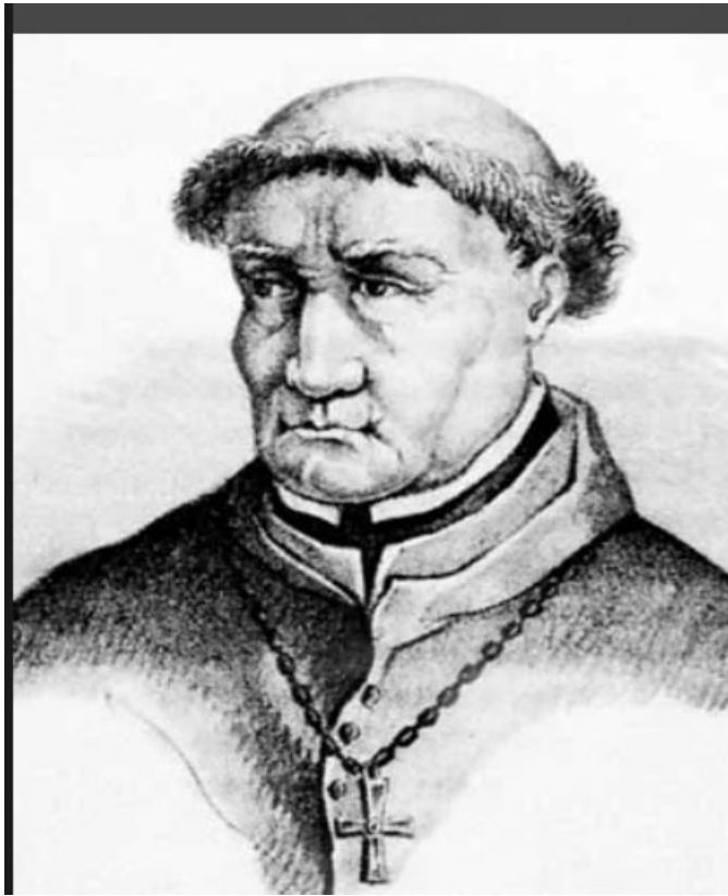
Prilog 4. Tomas de Torquemada