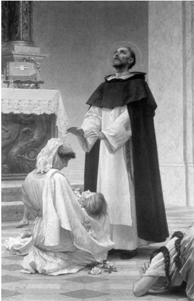
Prilog 2. Dominic de Guzman, utemeljitelj Dominikanskog reda