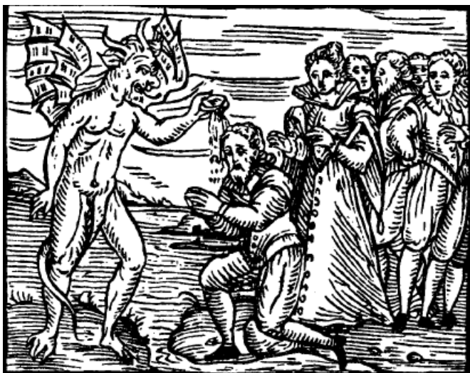
Prilog 5. Primjer noćnog sastanka i susreta s Đavlom