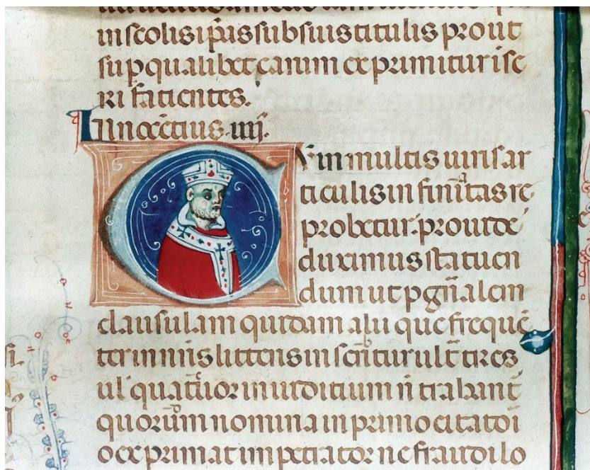
Prilog 1. Papa Inocent IV.