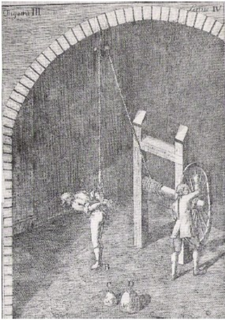
Prilog 7. Koloturi