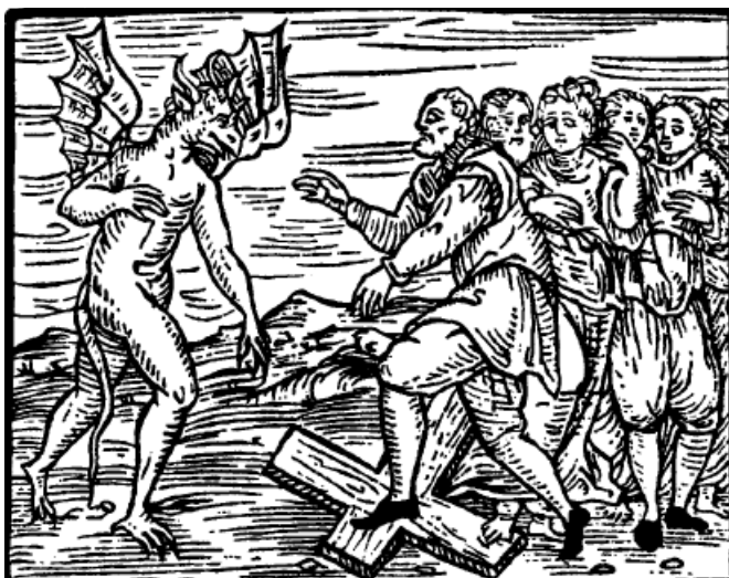
Prilog 6. Sklapanje ugovora s Đavlom te gaženje križa