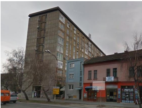
Slika 29. Ljepotica