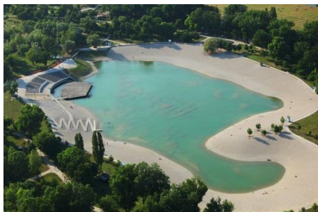
Slika 18. Bandek

Poznato zagrebačko umjetno jezero Bundek preimenovan je u „ Bandek “, prema gradonačelniku Milanu Bandiću. Jedno od najneobičnijih imena zasigurno nosi legendarna skulptura, tzv. „ Pimpek-plac “ koja se nalazi na križanju Maksimirske ulice i Svetica, tik uz nogometni stadion Maksimir. Skulptura je postavljena 1957. godine, a mnogi Zagrepčani ju oduvijek zovu tim neobičnim nadimkom. Riječ je o kipu Bacača diska. U bivšoj državi tradicionalno se na Uskrs Bacaču diska bojalo međunožje. Nakon nedjeljnih uskršnjih misa, obitelji bi odlazile do „ Pimpek-placa “ pogledati je li i ove godine „delala farba“. Zbog velike frekvencije Dinamovih navijača, spomenik je često bojan u plavu boju.