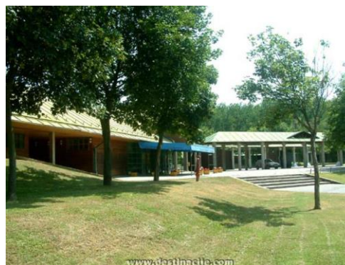
Slika 26. Pampika