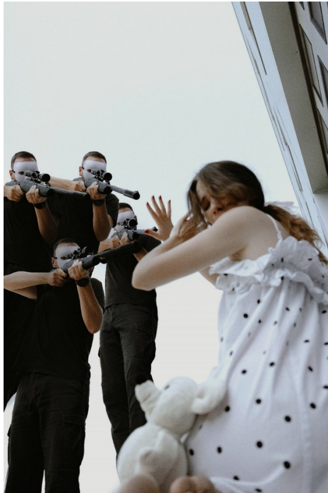
Abbildung 4 Das Stück von Marius von Mayenburg: Freie Sicht - Die Szene, in der das Mädchen erschossen wurde.

alle denken auf dieselbe Weise. Deshalb hinterlässt das Foto einen schmerzhaften Eindruck.