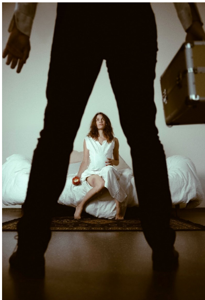
Abbildung 3 Das Stück von Lukas Bärfuss: Die sexuellen Neurosen unserer Eltern - Die Szene aus dem Hotelzimmer.

In diesem Teil wird das Foto einer ausgewählten Szene aus dem Werk von Lukas Bärfuss dargestellt. Die Abbildung 1 bezieht sich auf das Werk Die sexuellen Neurosen unserer Eltern . Es zeigt die Figur von Dora und dem Herrn im Hotelzimmer. Das Blau am Bein, das Weiß (Laken, Nachthemd, Wand) wird als Symbol für ihre Unschuld und Reinheit hervorgehoben. Der feine Herr hält die Schatulle in der Hand, denn er ist der Parfümvertreter. Dora hält symbolisch einen abgebissenen Apfel als Symbol der Versuchung/des Unheils. Die Farben bzw. die Lichteffekte auf dem Foto verraten die schmerzhaft und kranke Atmosphäre, in der sich die Figur des Kindes befindet.