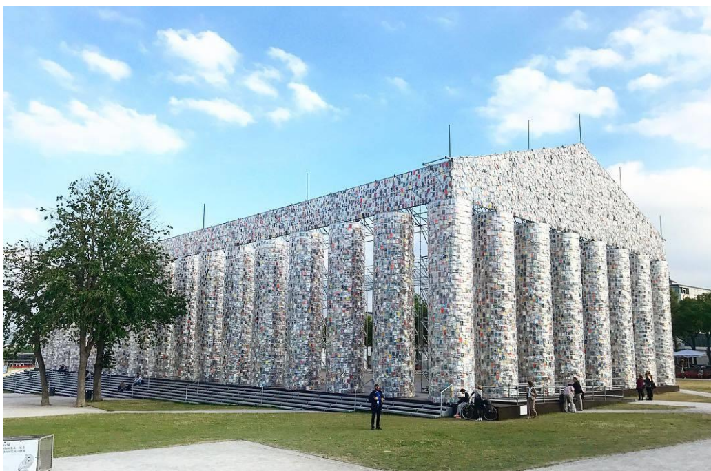
Slika 2. Hram zabranjenih knjiga, Kassel, Njemačka 77