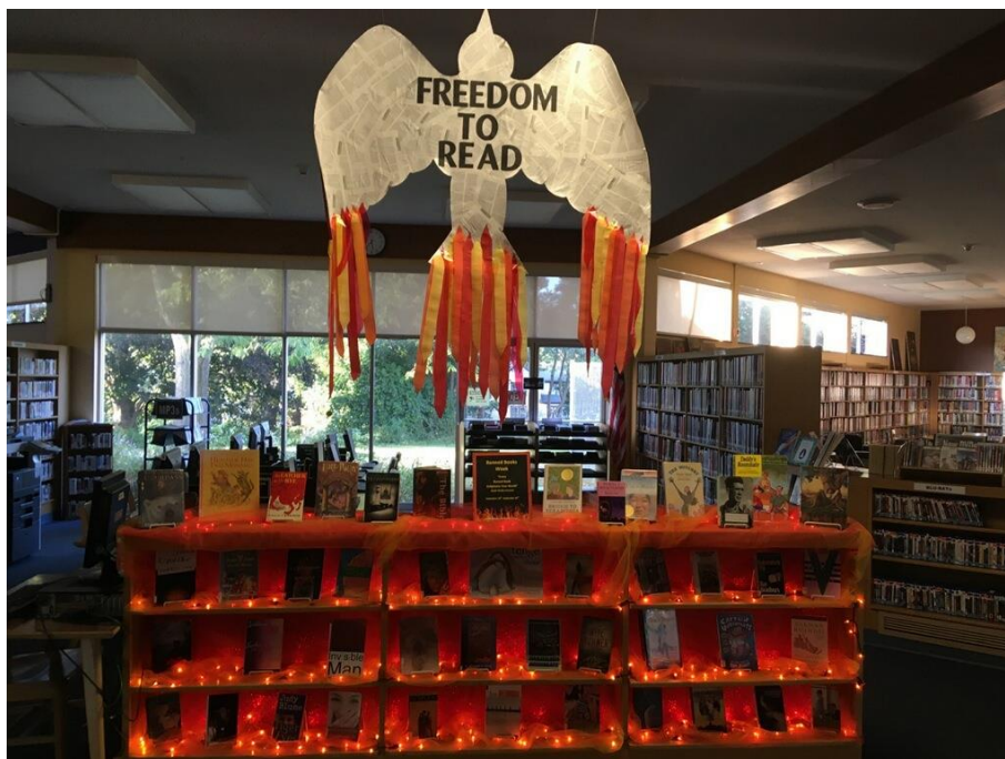
Slika 3. „Knjige u plamenu“, Knjižnica Okruga Onondaga 79