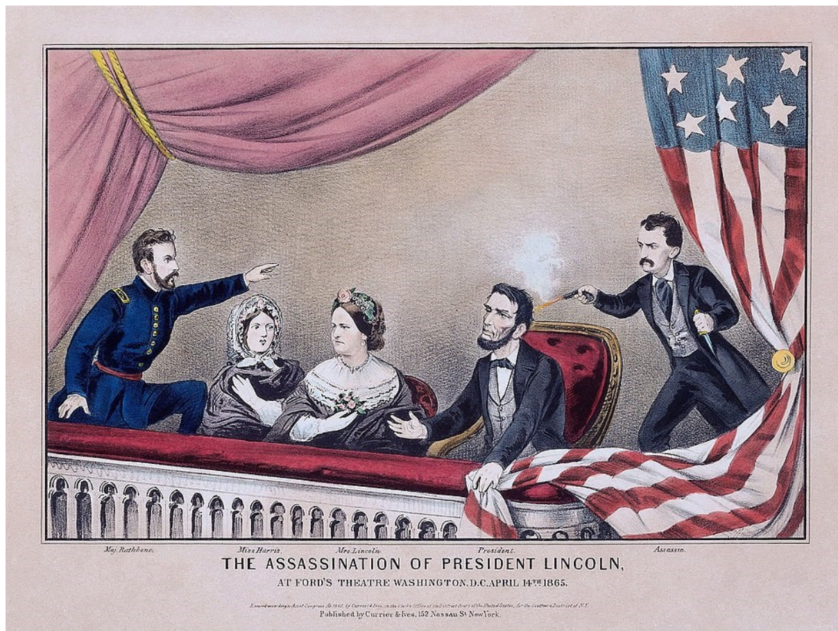
Prilog 3. Slikoviti prikaz Lincolnova ubojstva 1865. godine.